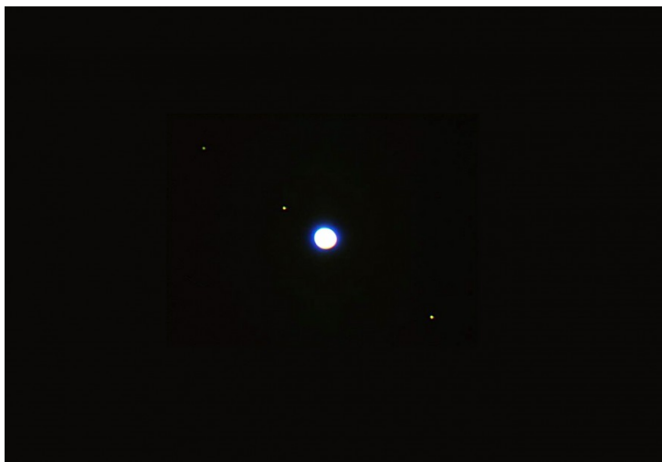
Figura 2: Giove come visibile attraverso un binocolo o un teleobiettivo.

le stelline fossero meno di quattro allora significa che alcune lune stanno transitando o di fronte o dietro il disco di Giove. Una volta individuati i satelliti galileiani è possibile determinarne il periodo di rivoluzione intorno a Giove come dimostrato nell'articolo " Studio dei satelliti di Giove con un telescopio amatoriale ".