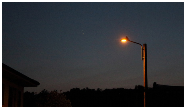
Figura 1: congiunzione Giove - Venere del 30 giugno 2015. Visto da Terra, Giove è (mediamente) il pianeta più luminoso dopo Venere.

Ancora oggi possiamo osservare ad occhio nudo sei dei sette pianeti del Sistema Solare (Terra esclusa) anche se, a dire il vero, Urano è ormai invisibile da gran parte dei cieli della nostra penisola a causa dell'eccessivo inquinamento luminoso. Di tutti i pianeti, Giove è il più luminoso dopo Venere. La differenza di luminosità tra i vari pianeti è ben visibile durante quei fenomeni astronomici noti come congiunzioni planetarie ovvero quando due o più pianeti si trovano prospetticamente vicini in cielo (Figura 1, congiunzione Giove-Venere del 30 giugno 2015 ).