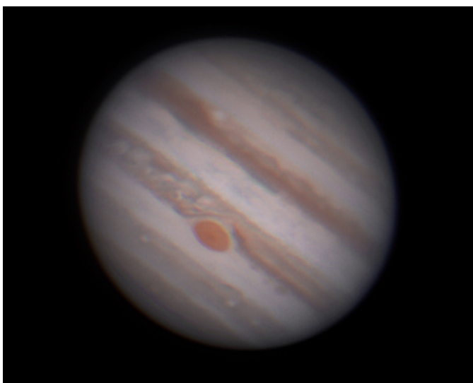
La Grande Macchia Rossa ripresa allo Smeraldino il 18/03/2016.

Queste sono strutture atmosferiche ruotanti in senso concorde o discorde a quello di rotazione del pianeta (si parla come sulla Terra di cicloni ed anticicloni). A differenza della Terra però su Giove gli anticicloni sono dominanti numericamente. I vortici non sono fenomeni perenni ma hanno una vita che varia da diversi giorni a centinaia di anni. Gli anticicloni sono di colore chiaro e si dispongono longitudinalmente al disco planetario e tendono a fondersi quando vengono a contatto. I cicloni sono invece di dimensioni inferiori e colore bruno. Esistono comunque due particolari tipi di anticicloni peculiari: la grande macchia rossa e l' ovale BA . Questi due sono di colore rosso a seguito del materiale portato in alta atmosfera dalle profondità del pianeta. La prima ha dimensioni paragonabili a quelle di circa due/tre Terre (provate a misurarle con il vostro telescopio utilizzando la tecnica prima descritta per determinare il diametro di Giove), colore variabile dal bianco al rosa pastello al rosso mattone e venne osservata per la prima volta nel 1665 dall'astronomo Giovanni Cassini (Figura 6). L'ovale BA detta anche piccola macchia rossa si è formato nel 2000 ed ha iniziato a tingersi di rosso nel 2005. Le sue dimensioni stanno via via crescendo ed ormai hanno raggiunto la metà di quelle della grande macchia rossa.