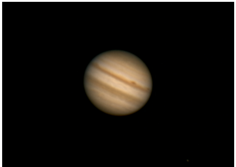
Figura 3: Le due bande equatoriali di Giove

Proseguiamo ora il nostro viaggio aumentando gli ingrandimenti. Per fare ciò bisogna abbandonare gli strumenti più comuni (binocoli e teleobiettivi) per passare ai ben più potenti mezzi forniteci dall'ottica: i telescopi. Già con un piccolo telescopio è possibile osservare alcuni dettagli del disco planetario: le bande atmosferiche (Figura 3).