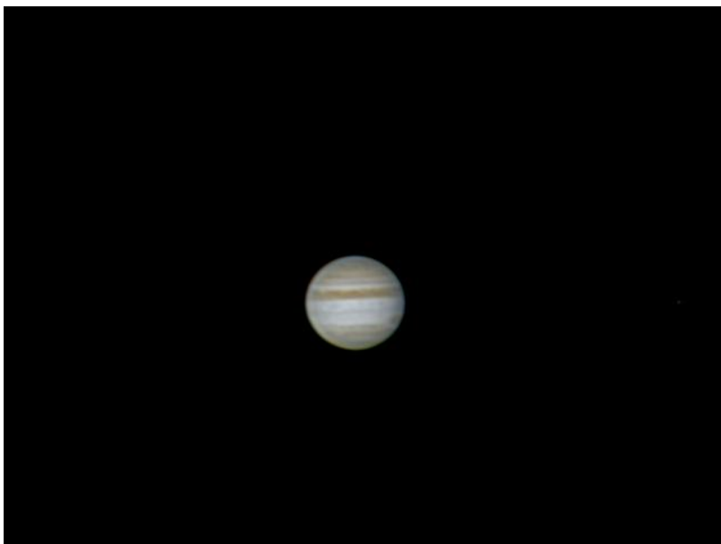
Figura 4: un disturbo ripreso il 02

Le bande sono strutture pressoché stabili. Talvolta però è possibile osservare dei fenomeni sporadici, noti come disturbi che ne frammentano il decorso, facendo "scompare" la banda equatoriale sud. Tali disturbi si manifestano ad intervalli irregolari di 3-15 anni e sono associati alla momentanea (settimane o mesi) sovrapposizione di più strati nuvolosi a quote diverse. ASTROtrezzi ha ripreso un evento di disturbo nel 2010 (Figura 4).