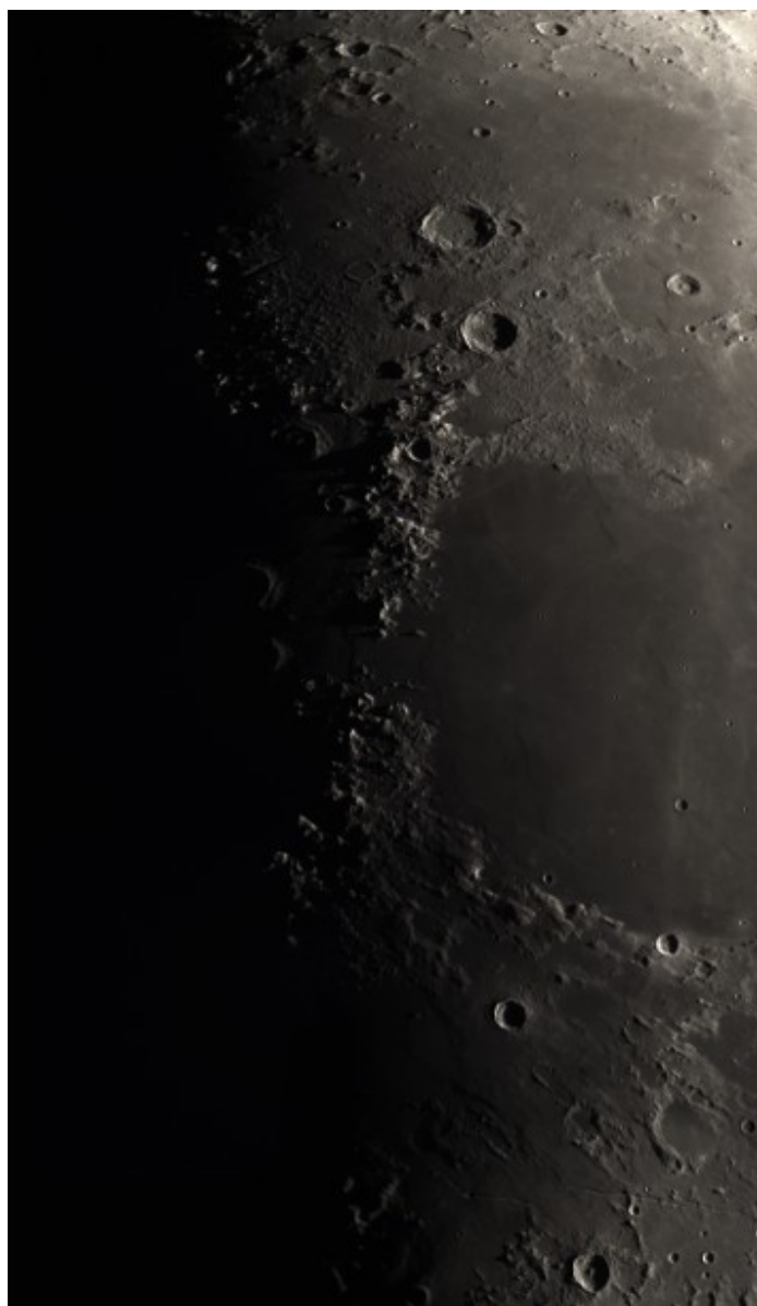
Montes Caucasus - 22/04/2018

mosaic of 9 panels done with a 3x Barlow lens