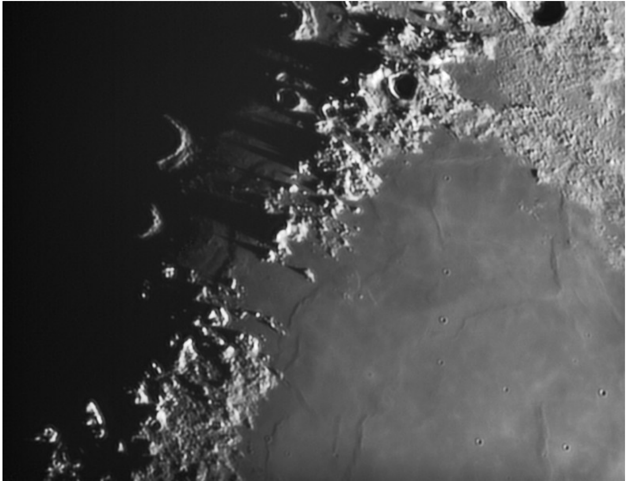
Montes Caucasus in infrared - 22/04/2018