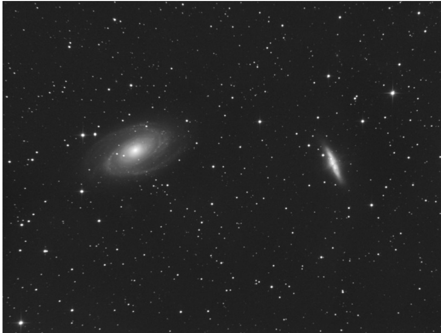
Supernova SN2014J in M82 - 24/01/2014 (Luminanza)

Note (note): Riportiamo il canale di Luminanza e l'immagine finale LRGB ottenuta utilizzando la ripresa RGB del 06/03/2011 . (LRGB image obtained using the 06/03/2011 RGB picture).