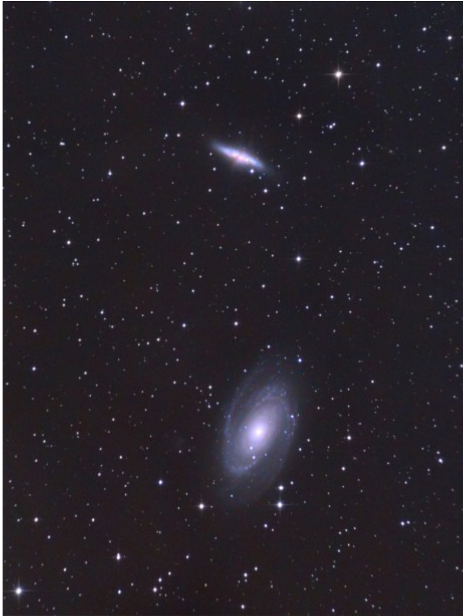
Supernova SN2014J in M82 - 24/01/2014 (composizione LRGB)