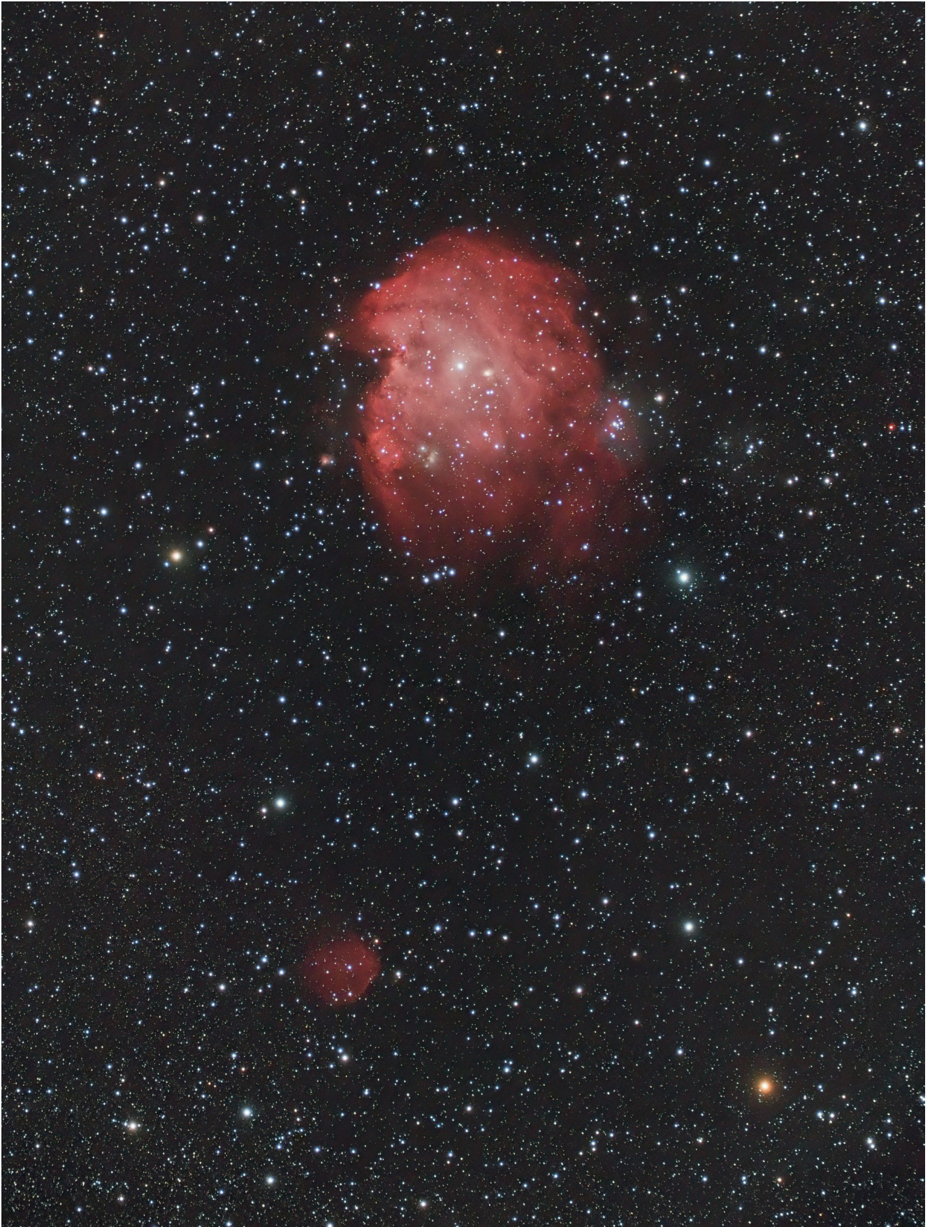
NGC 2174 e Sh2-247 (telescopio/telescope #1 and #2) composizione/composition (50%H \alpha +50%R)GB – 01/03/2022