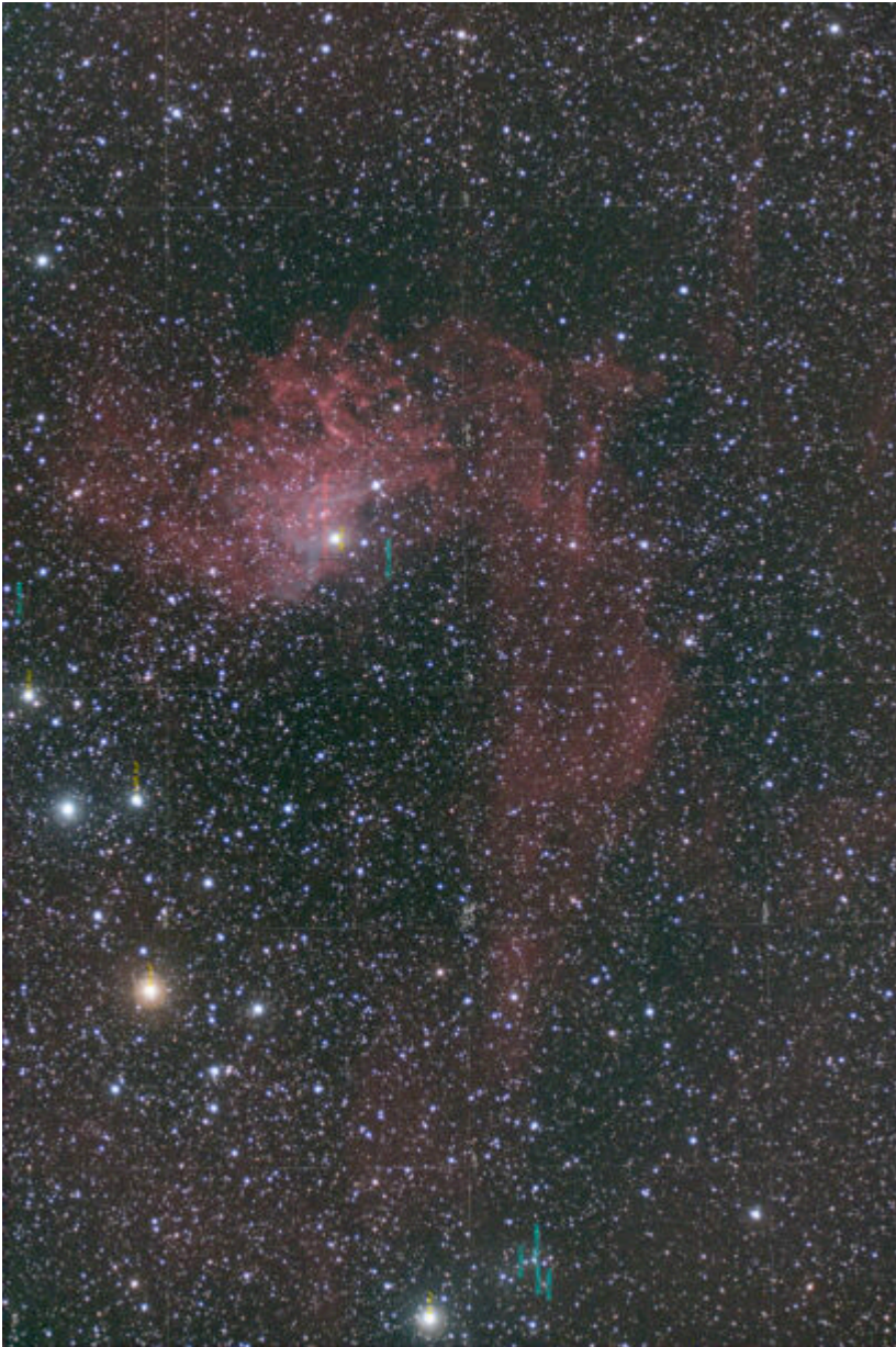
IC 405 (telescopio/telescope #2) mappa oggetti (DSO map). Visibili alcune galassie del catalogo PGC (PGC galaxies are shown) – 14/03/2021