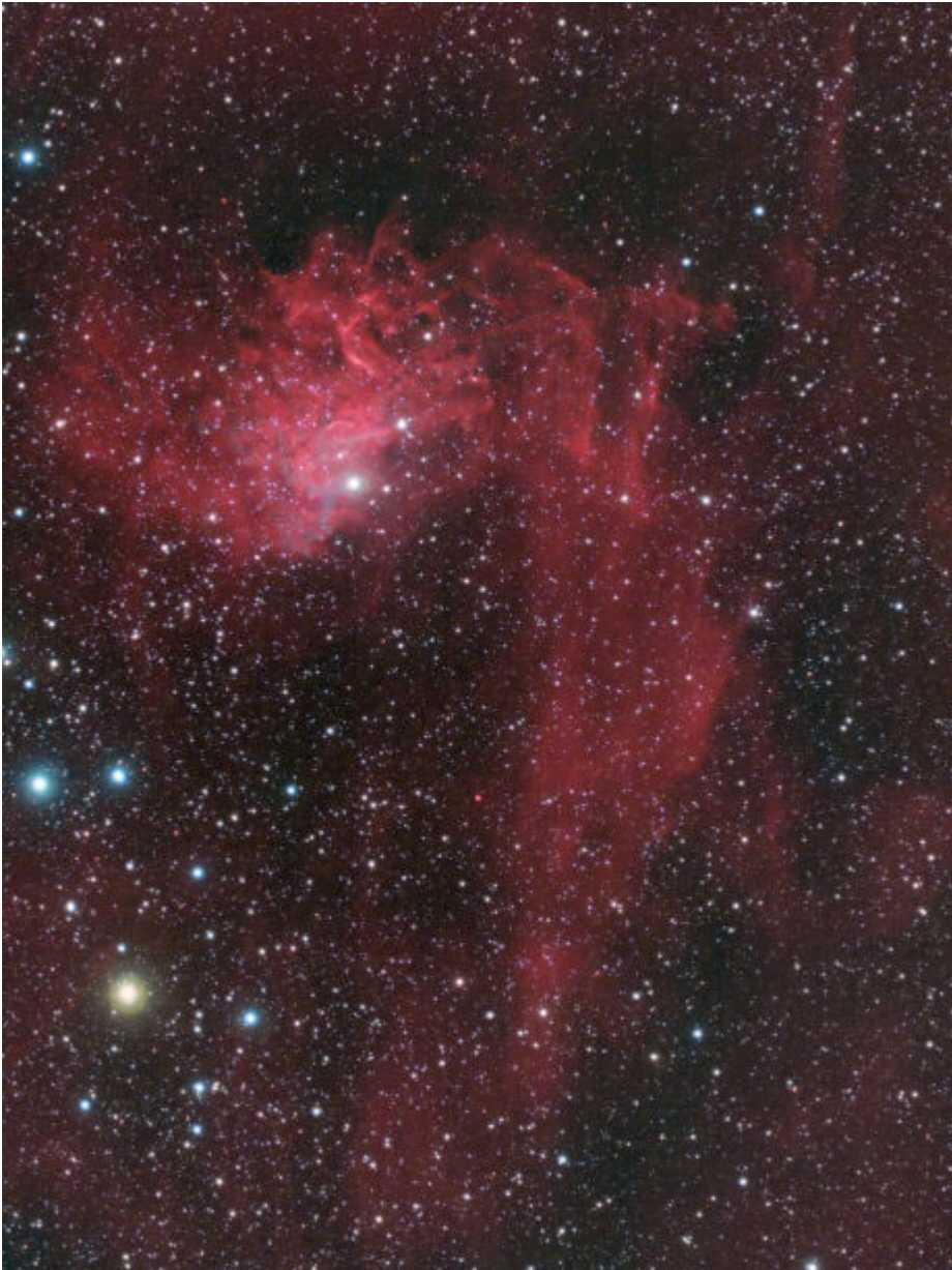
IC 405 (telescopio/telescope #1 and #2) composizione/composition (80% H\alpha +20%R)GB - 14/03/2021