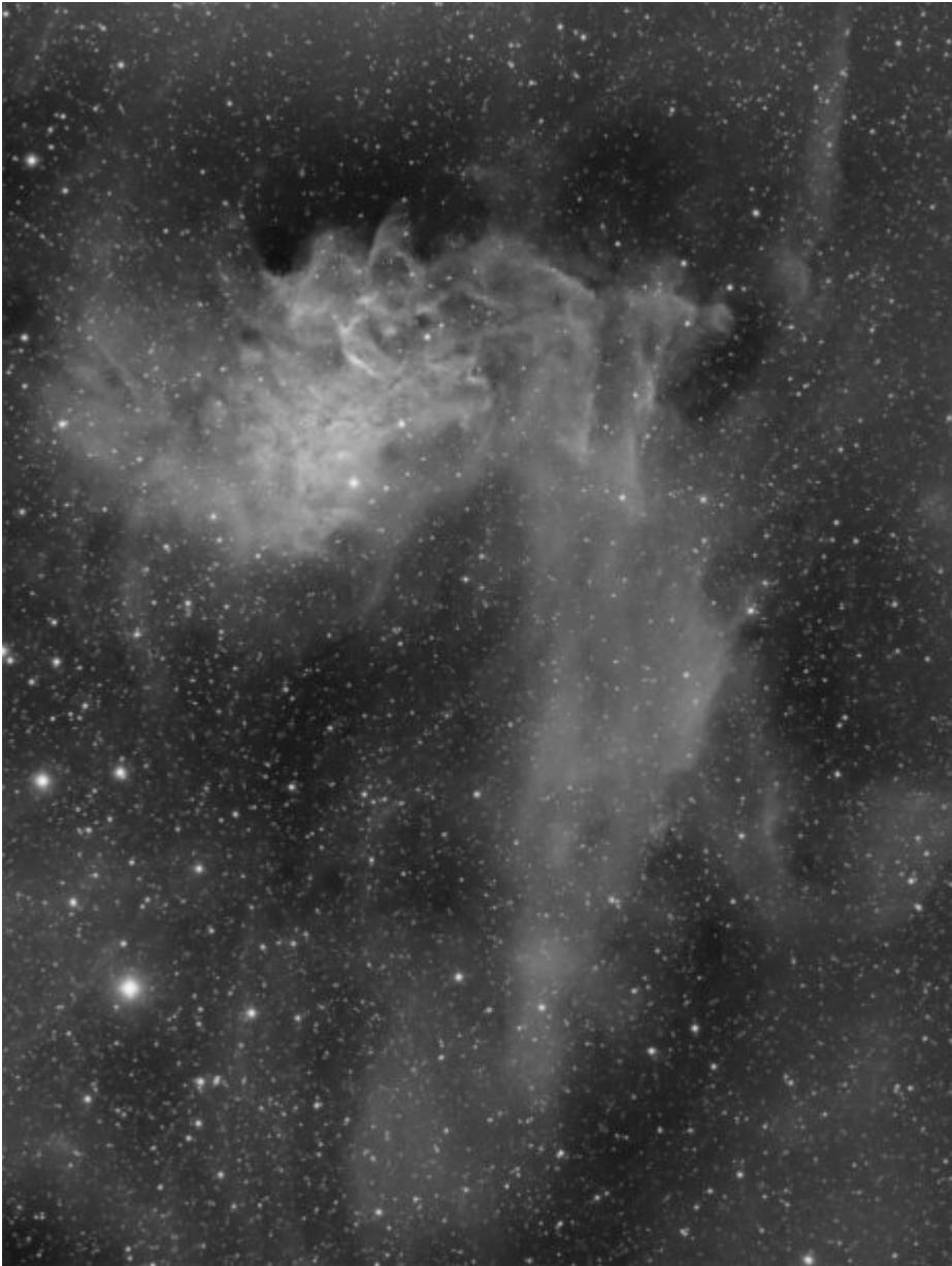
IC 405 (telescopio/telescope #1) – 14/03/2021