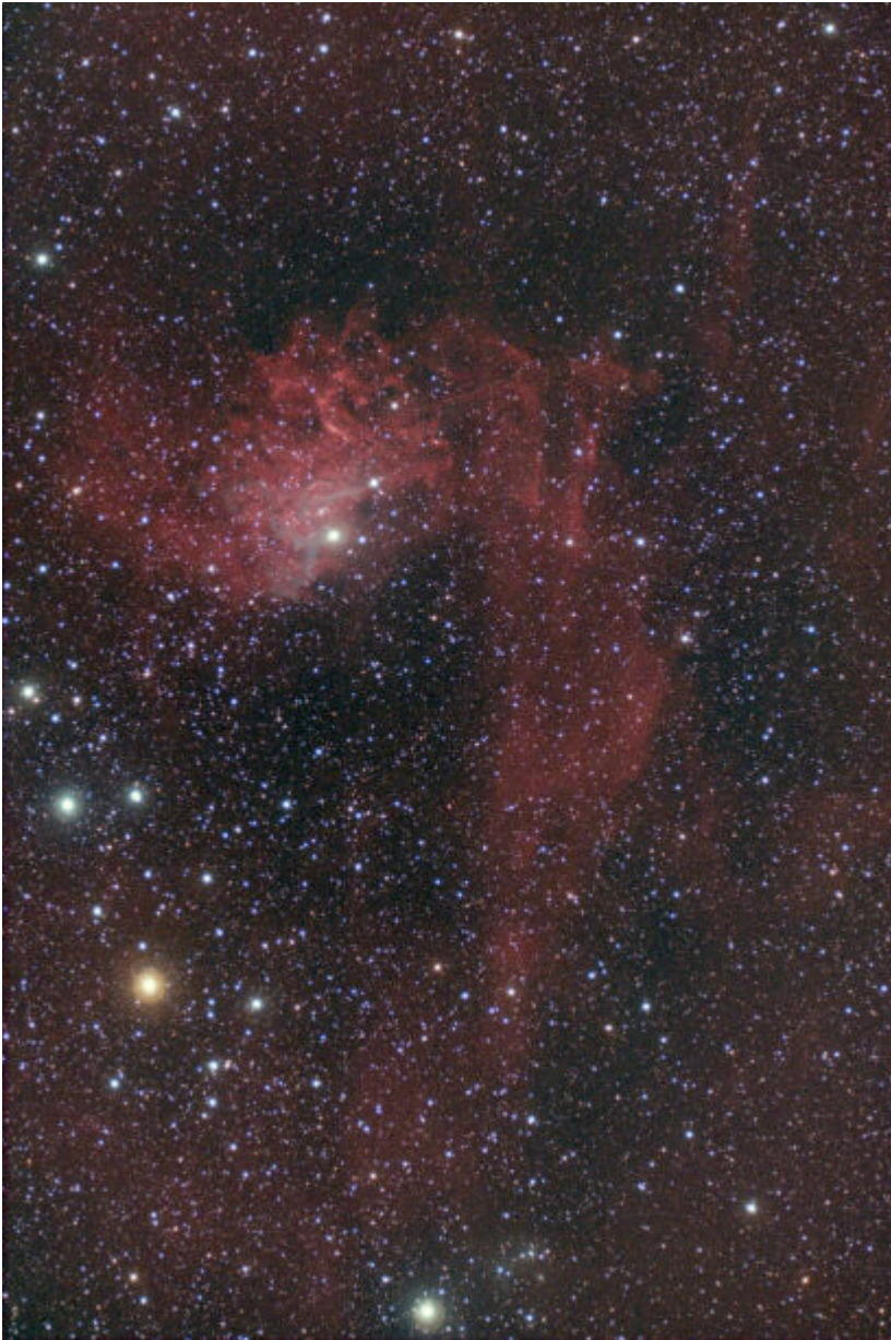
IC 405 (telescopio/telescope #2) – 14/03/2021