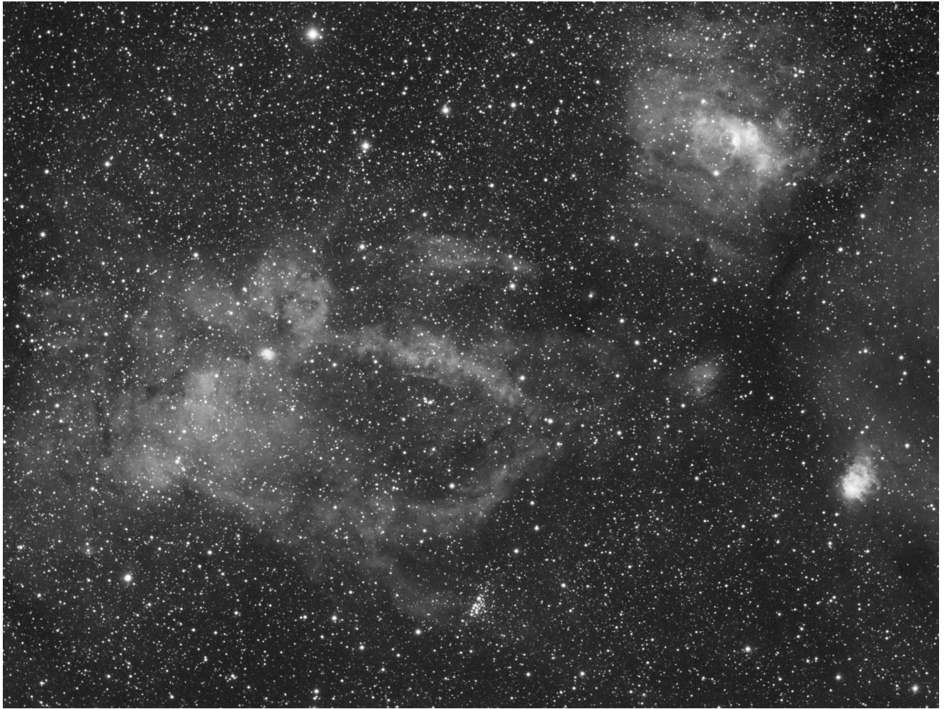
Sh2 157 (telescopio/telescope #1) – 05/11/2021