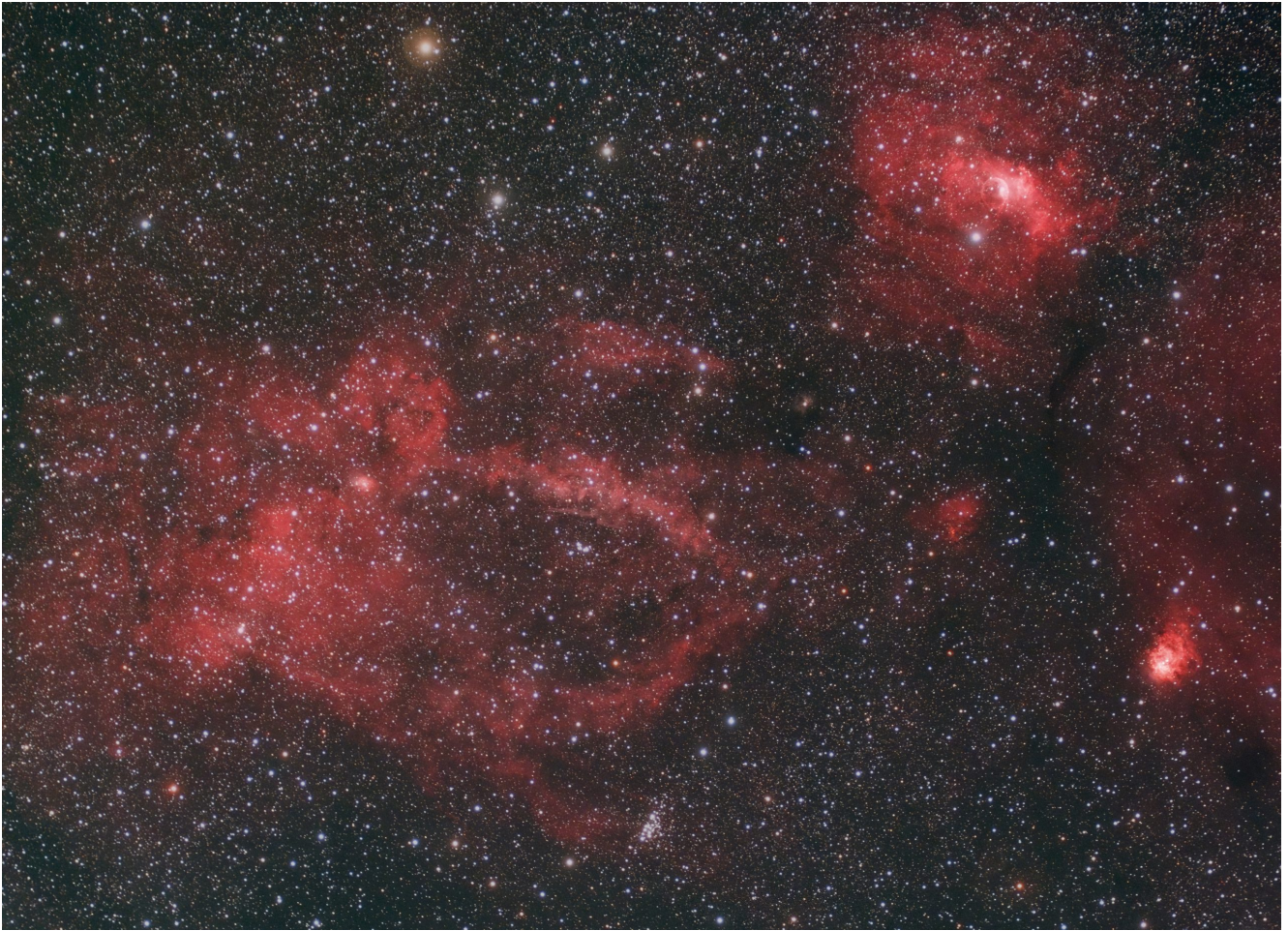
Sh2 157 (telescopio/telescope #1 and #2) composizione/composition (50%H \alpha +50%R)GB - 05/11/2021