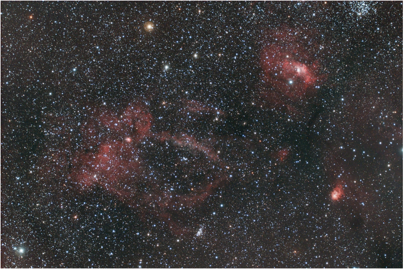
Sh2 157 (telescopio/telescope #2) – 05/11/2021