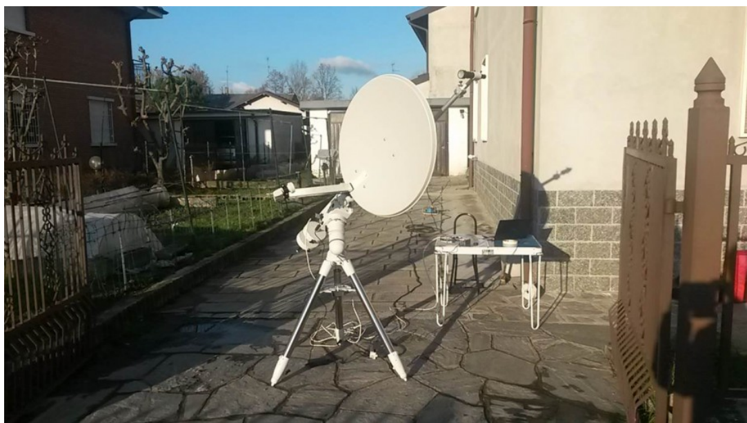
Figura 3: il progetto RadioASTR080 in funzione.

Il software, interamente sviluppato da ASTROtrezzi è open source e pertanto può essere distribuito e modificato. Consigliamo comunque la segnalazione all'indirizzo davide@astrotrezzi.it . Il sistema antenna + LNB + satellite finder (alimentato esternamente da rete elettrica domestica) + amplificatore operazionale + Arduino + PC, detto RadioASTR080 è mostrato in Figura 3. Questo può essere montato comodamente su una montatura equatoriale. Nel caso di RadioASTR080 abbiamo utilizzato una SkyWatcher NEQ6 con attacco Losmandy.