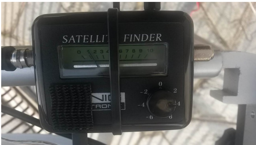
Figura 2: l'asta graduata (da 1 a 10) dell'intensità del segnale

Il satellite finder però non genera solo un segnale audio, ma la stessa tensione che alimenta il "cicalino", permette ad un'asticella analogica di muoversi su una scala graduata la quale quantifica l'intensità del segnale a microonde (vedi Figura 2).