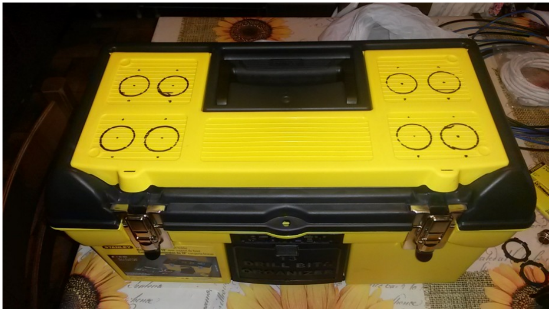
Figura 1: la posizione delle porte accendisigaro sulla cassetta degli attrezzi

Iniziamo pertanto con il forare la nostra cassetta degli attrezzi in modo da poter fissare le porte accendisigaro come riportato in figura 1.