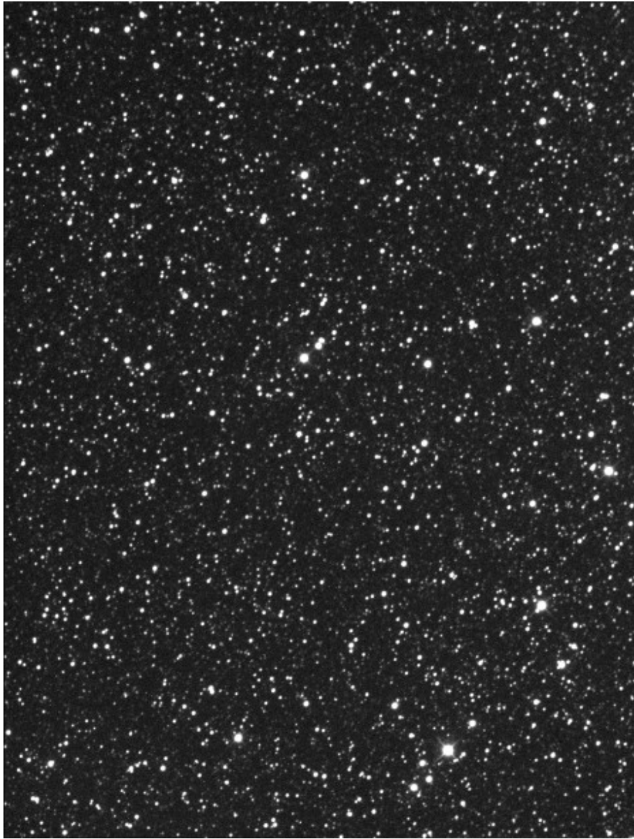
Plutone - 17/05/2015