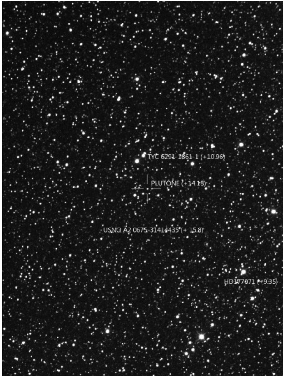
Plutone - 17/05/2015