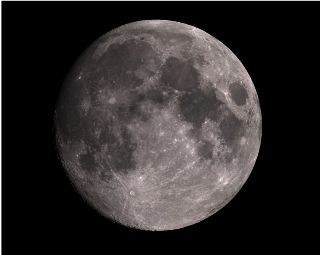
Luna - 09/04/2017

Particolare della regione del cratere Phocylides: