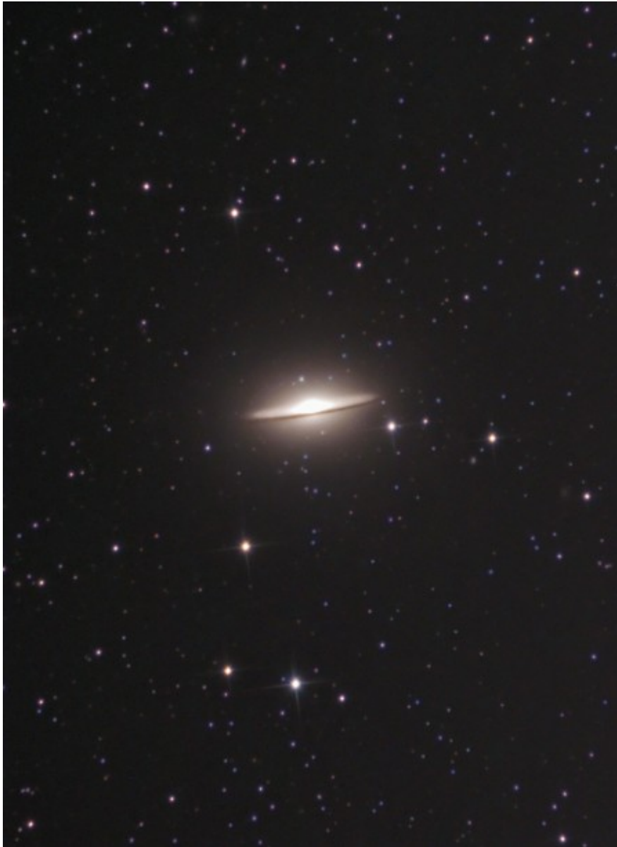
M104 (NGC 4594) - 13/04/2013

Note (note): LRGB. Magnitudine limite compresa tra +20 e +21 (maximum magnitude +20/+21).