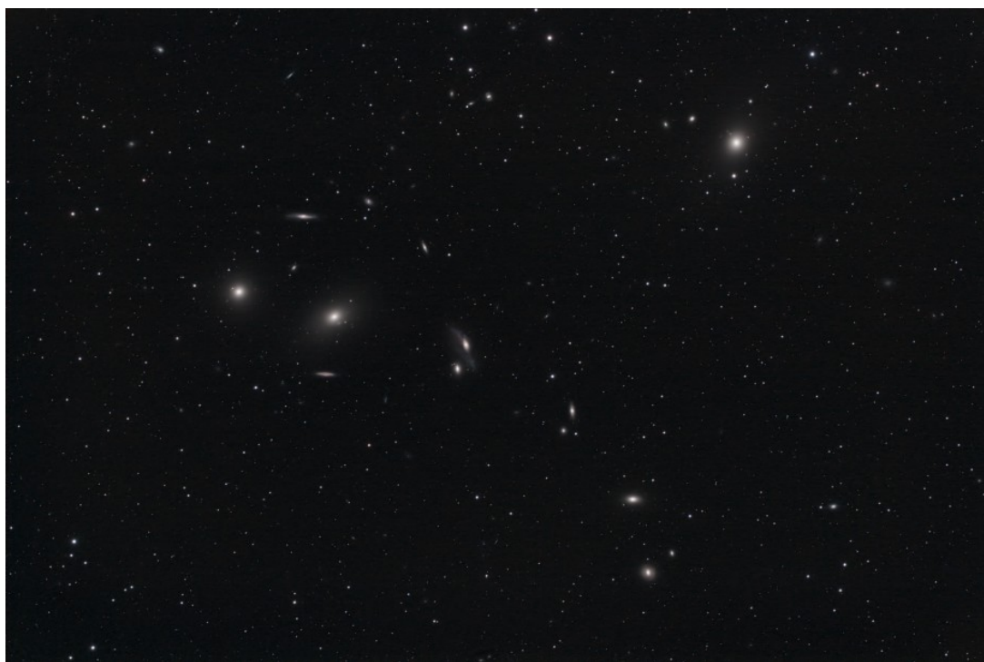
Catena di Markarian - 03/01/2017