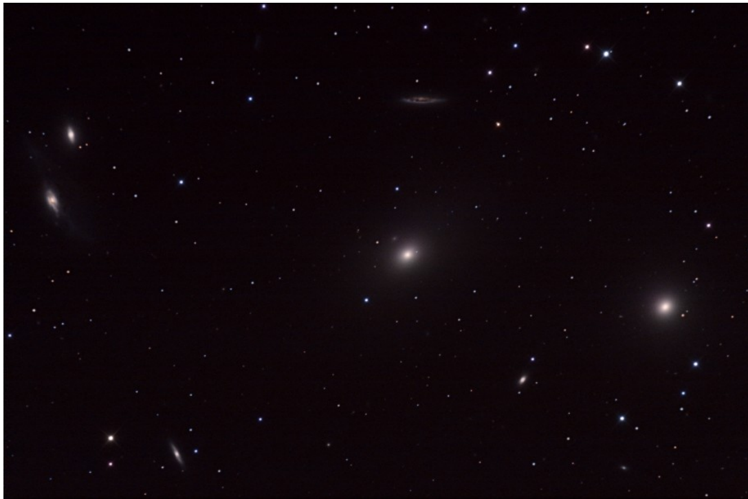
M84 - M86 (NGC 4374 - NGC 4406) | 10/05/2015

Focale equivalente (Equivalent focal length): 1595 mm