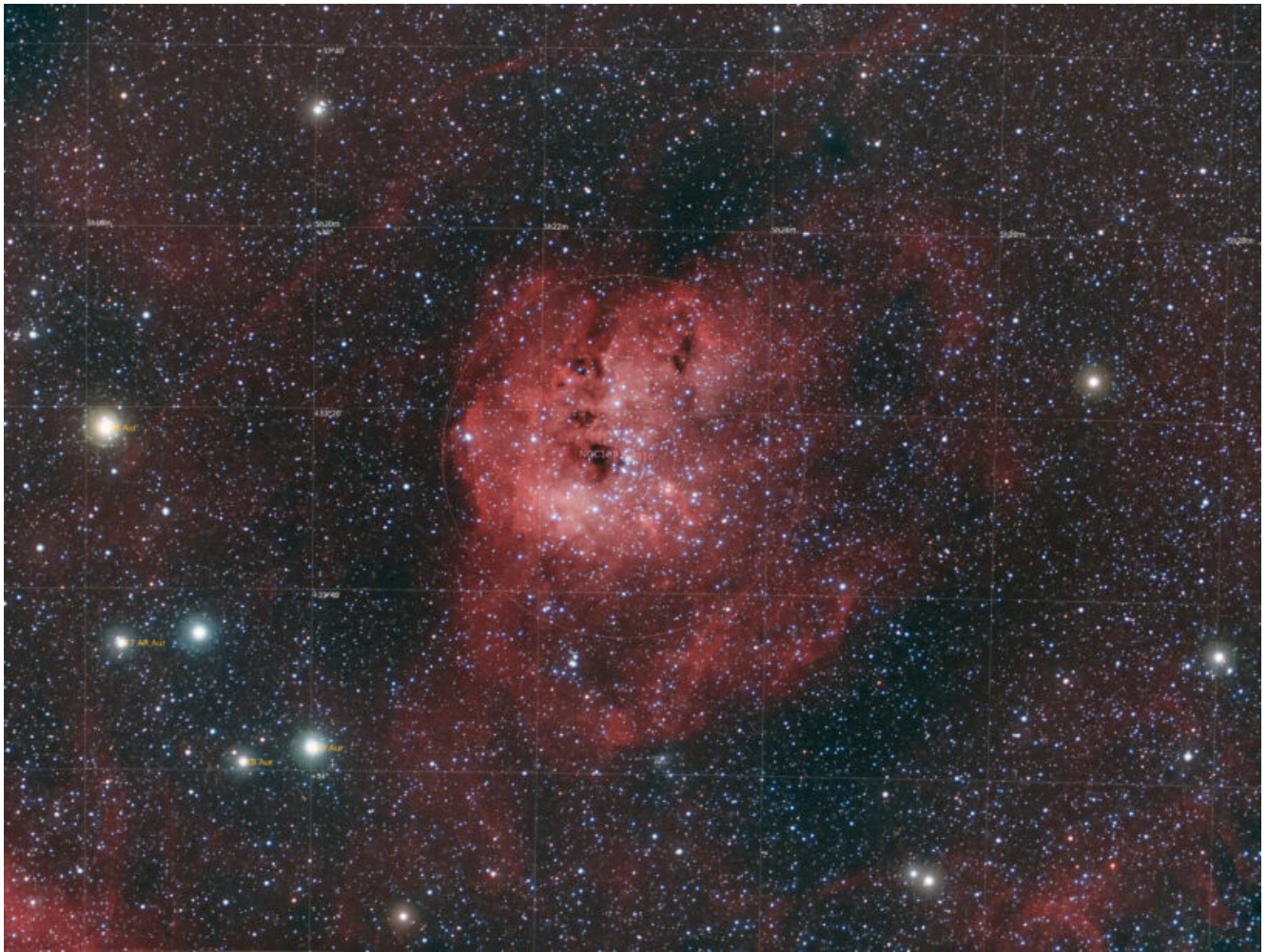
IC 410 (telescopio/telescope #2) mappa oggetti (DSO map). Visibili l'ammasso aperto NGC 1893 (open cluster NGC 1893 is shown) – 15/03/2021