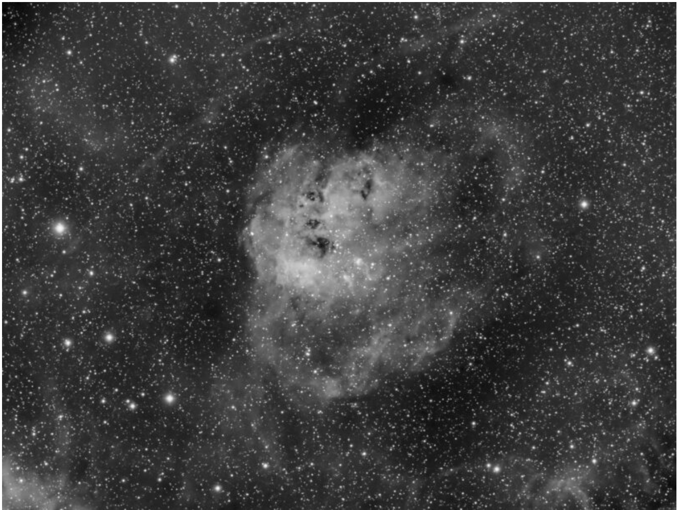
IC 410 (telescopio/telescope #1) – 15/03/2021