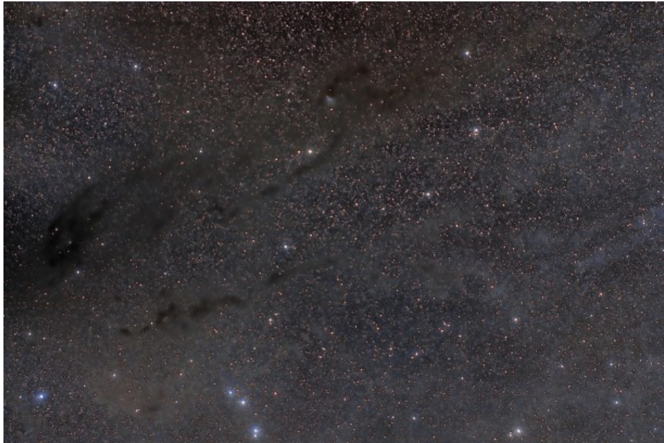
Nube Molecolare del Toro - 18/01/2018

Note (note): immagine singola della nebulosità e mosaico della stessa con l'immagine delle Pleiadi ripresa il 18/12/2017 (Single shot and a mosaic of this one with a previous Pleiades image taken the 18th of December 2017).