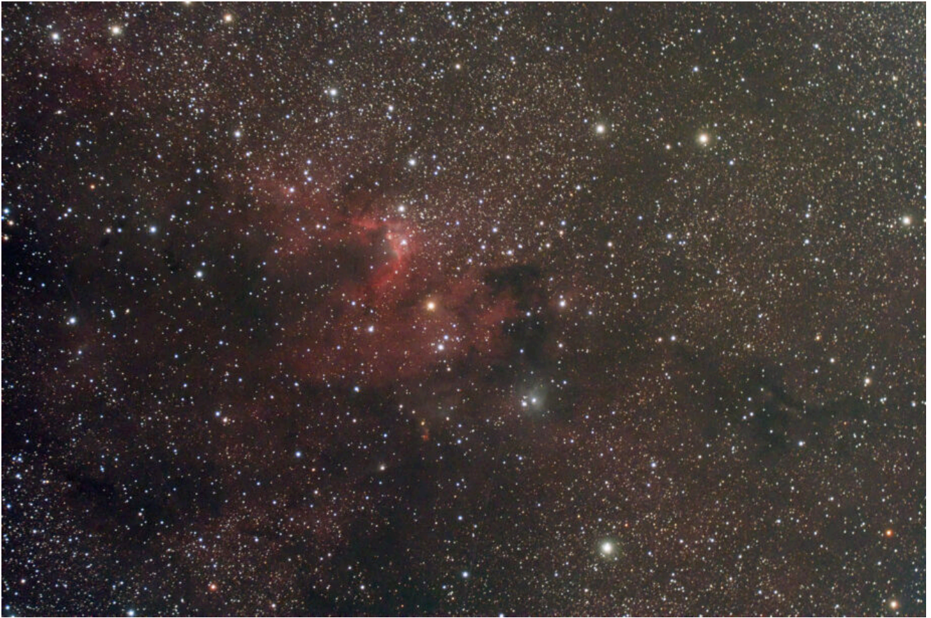
Sh2-155 (telescopio/telescope #2) – 03/10/2022