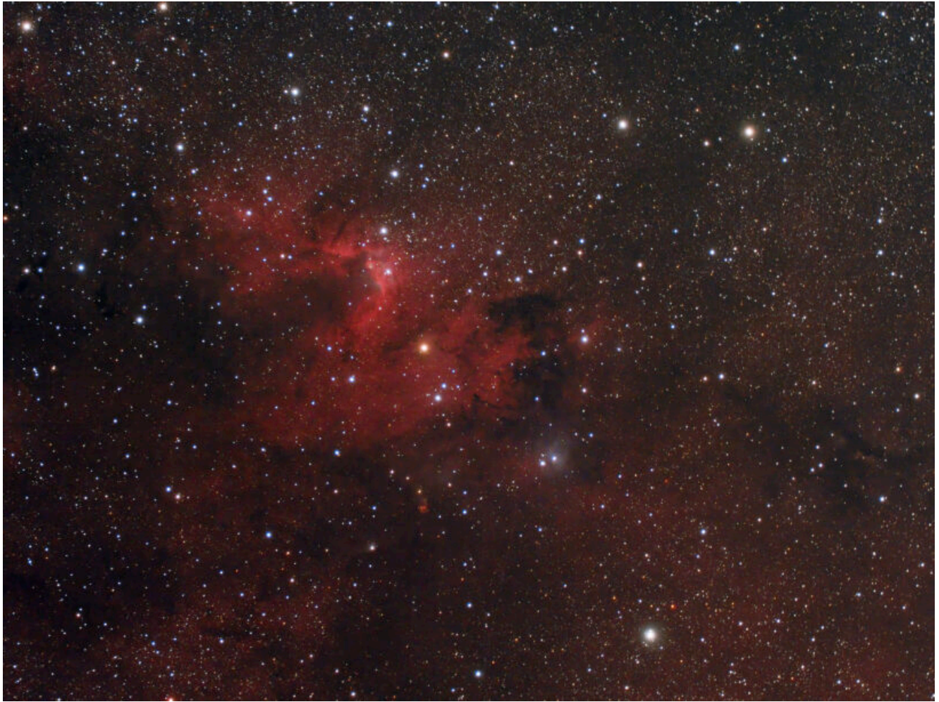
Sh2-155 (telescopio/telescope #1 and #2) composizione/composition (80% H\alpha +20%R)GB - 03/10/2022