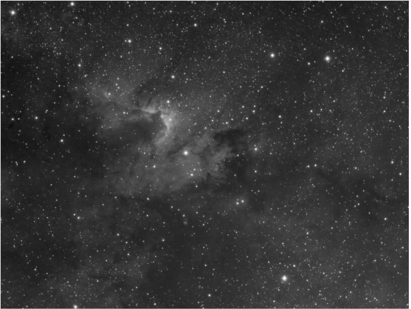
Sh2-155 (telescopio/telescope #1) – 03/10/2022