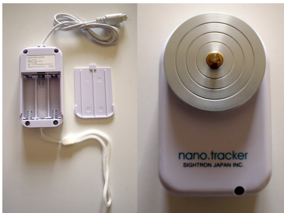
Figura 2: il telecomando di controllo a sinistra e l'astroinseguitore a destra.

Entrambe i pezzi risultano di ottima fattura e curati nei minimi dettagli. Abbiamo particolarmente apprezzato è il comodo laccio per legare il telecomando al treppiede durante le riprese. Si procede quindi con l'inserimento delle batterie nel telecomando di controllo tramite l'apposito cassetto (vedi Figura 2).