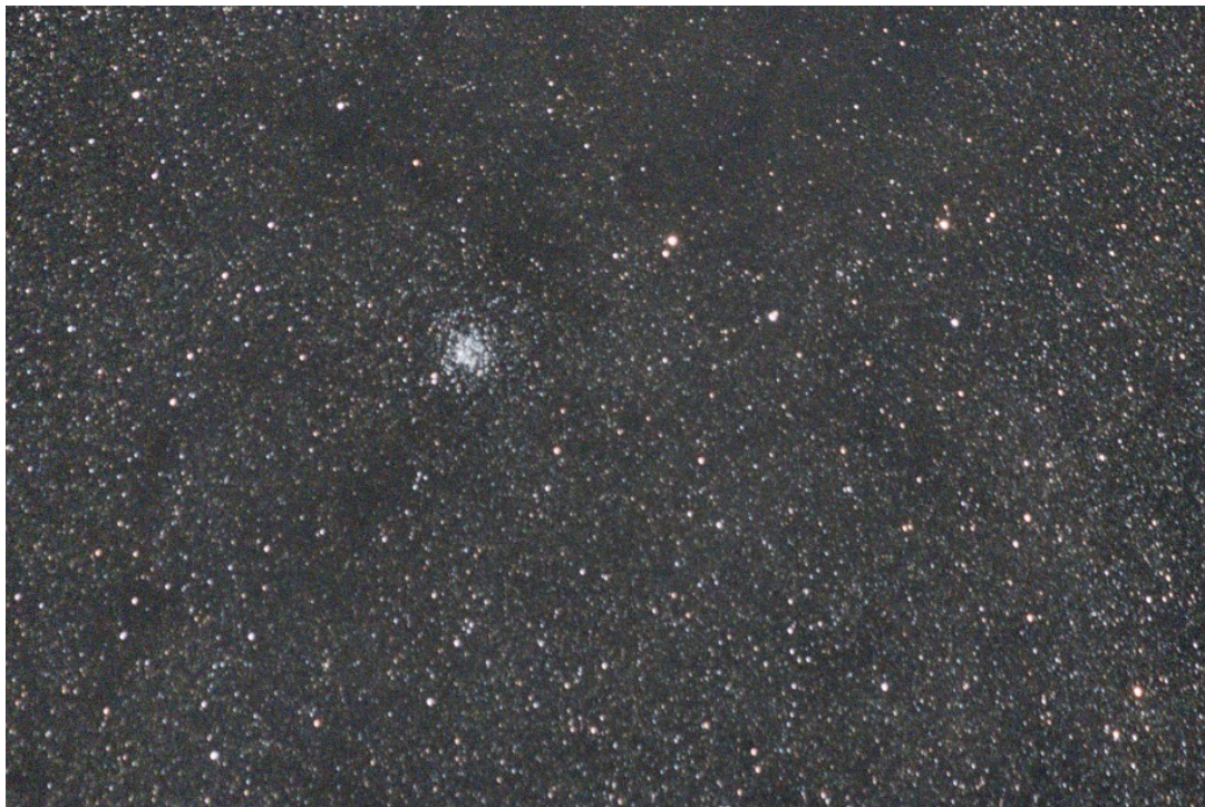
Figura 9: crop dell'immagine dell'ammasso aperto M11 ripreso con a 300 mm di focale. Elaborazione effettuata con IRIS + Photoshop CS3