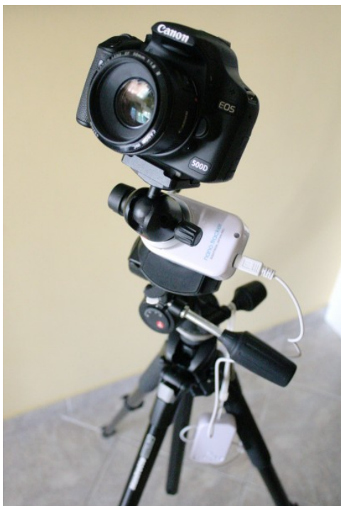
Figura 5: Il nano.tracker nella sua configurazione finale.

durante il giorno. Al fine di allineare la montatura con il polo celeste nord è stato praticato un foro passante nell'astroinseguitore. La procedura di allineamento è ben descritta nel manuale di istruzione e consiste nell'inquadrare la stella Polare al centro del foro passante.