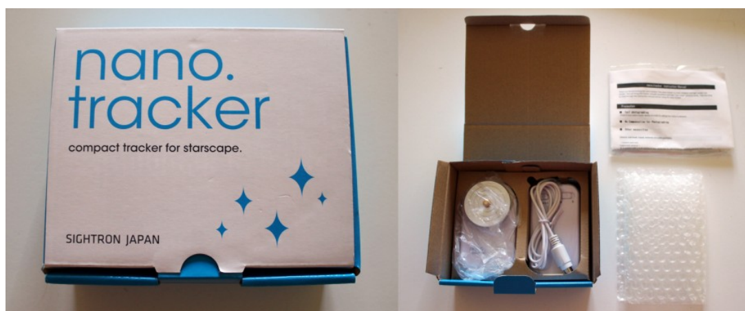
Figura 1: a sinistra la scatola del nano.tracker mentre a destra il suo contenuto.

Il nano.tracker si presenta compatto e ben imballato nella sua confezione. Seppur di piccole dimensioni, l'astroinseguitore pesa circa mezzo chilogrammo (480 grammi, batterie escluse). Una volta aperta la confezione si trova del materiale da imballaggio, le istruzioni conservate in una busta di plastica e finalmente il nano.tracker composto rispettivamente dall'astroinseguitore e dal telecomando di controllo (vedi Figura 1).