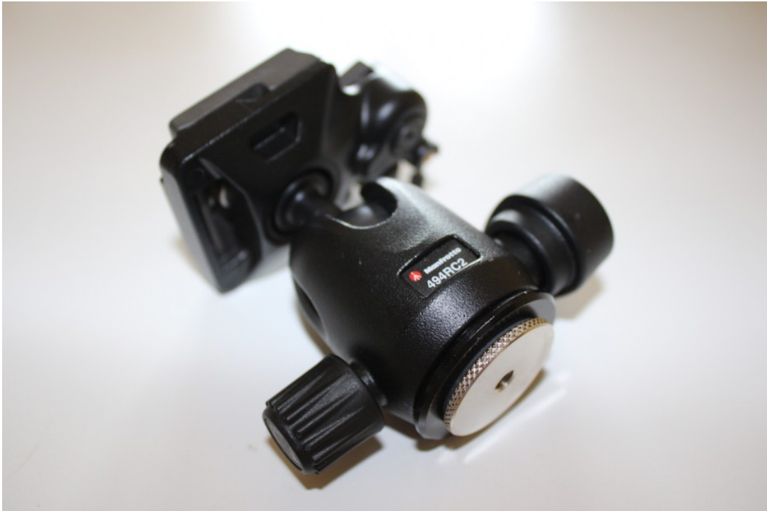
Figura 4: La testa Manfrotto 494RC2 con l'adattatore da 3/8 di pollice a 1/4 di pollice Manfrotto 088LBP.

adattatore 1/4-3/8 di pollice come ad esempio il Manfrotto 088LBP (vedi Figura 4).