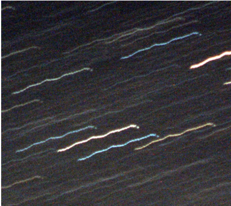
Figura 7: zoom delle tracce dovute al non perfetto inseguimento del nano.tracker in 16 minuti di posa. Si può osservare l'errore periodico del sistema.

A partire da tale immagine abbiamo potuto stimare un drift di circa 0.82 arcsec al secondo. Sulla base dei nostri test abbiamo stimato come “massima elongazione” una traccia stellare lunga 5 pixel. Utilizzando questa convenzione e sulla base del risultato ottenuto a partire dallo studio di Figura 7 possiamo determinare i “massimi” tempi di esposizione al fine di non ottenere mosso nelle condizioni sperimentali del test. Dato che la precisione di inseguimento dipende dalla bontà del puntamento polare, il test è indicativo e potrebbe se rifatto dare risultati leggermente differenti (migliori o peggiori).