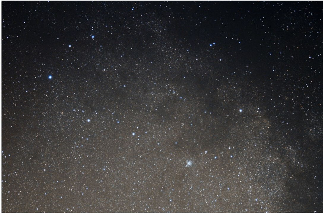
Figura 8: crop dell'immagine della costellazione dello Scudo ripresa con a 100 mm di focale. Elaborazione effettuata con IRIS + Photoshop CS3