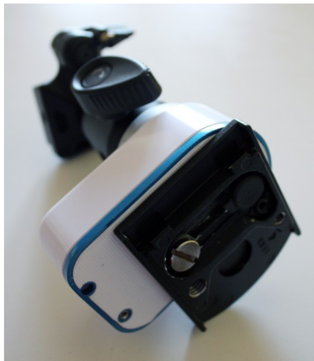
Figura 3: l'attacco tra l'astroinseguitore e la testa di regolazione dell'asse polare. In figura si vede anche la rondella descritta nel testo.

Il collegamento tra la testa per la regolazione dell'asse polare e il nano.tracker è effettuata tramite vite da 1/4 di pollice presente sulla basetta del Manfrotto 808RC4. Purtroppo si è reso necessario l'inserimento di una rondella (vedi Figura 3), in quanto il foro da 1/4 di pollice presente sul nano.tracker non è profondo a sufficienza.