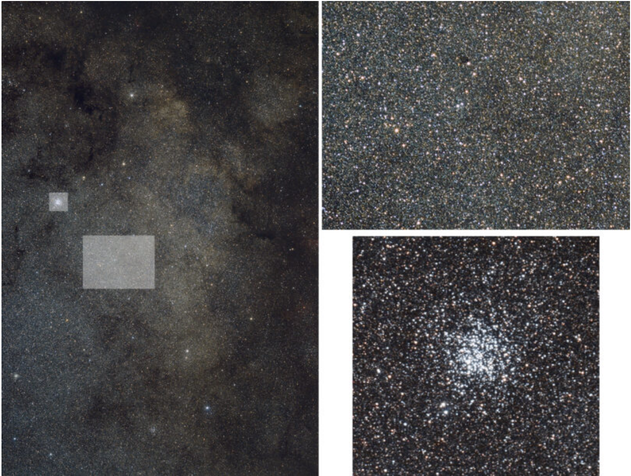
Immagine di una porzione della Via Lattea ripresa dall' Alpe Giumello – Casargo (LC) . A destra un ingrandimento di alcune parti per mostrare l'enorme numero di stelle in essa contenute.

Tutte le stelle che osserviamo e che possiamo osservare di notte, più di 200 miliardi, appartengono a quella che noi chiamiamo Galassia , con la G maiuscola. Questa è la nostra casa, il luogo dove il Sole e la Terra si sono formati circa cinque miliardi di anni fa.