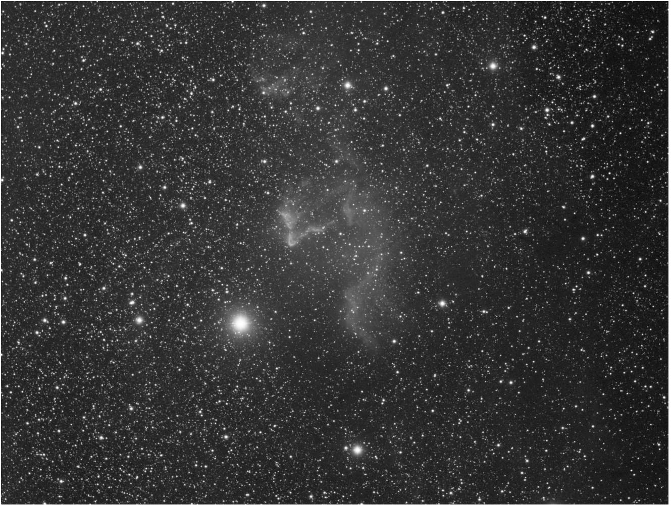
Sh2 185 (telescopio/telescope #1) – 06/11/2021