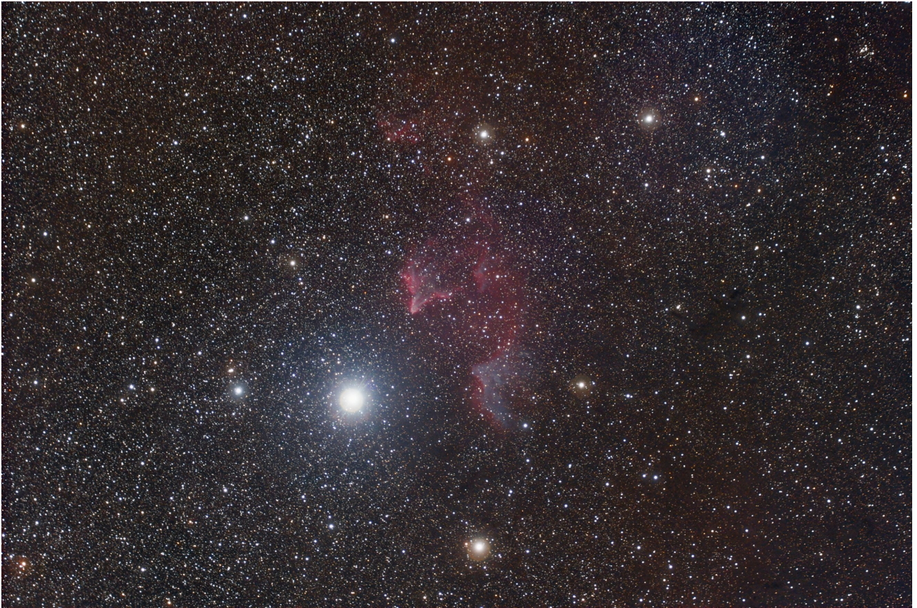
Sh2 185 (telescopio/telescope #2) – 06/11/2021