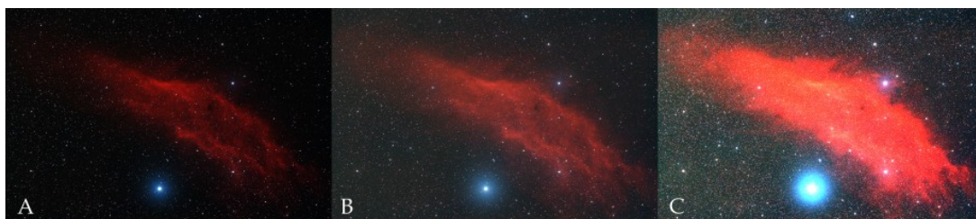
Figura 1: (A) immagine che non sfrutta appieno la dinamica, (B) immagine corretta, (C) immagine in saturazione

Prima di tutto dobbiamo chiederci quale è il tempo di esposizione che abbiamo a nostra disposizione. Ricordiamo ancora una volta come quest'ultimo sia il parametro fondamentale della nostra ripresa astronomica. Supponiamo di avere un tempo t massimo dettato da vari fattori (tempo a disposizione, rischio meteo o inquinamento luminoso, qualità di inseguimento della montatura, numero di scatti che vogliamo mediare ...). Andiamo quindi a misurare quanti elettroni riusciamo a collezionare in questo tempo utilizzando la nostra ottica (obiettivo fotografico o telescopio ad un certo rapporto focale fissato). Per fare ciò impostiamo gli ISO al minimo. Se già con gli ISO al minimo la nostra foto risulta già in saturazione (perdiamo informazione sui bianchi) allora sarà necessario abbassare il tempo di esposizione, altrimenti dovremo modificare gli ISO in modo che la nostra dinamica venga completamente coperta dai 16 bit dell'ADC. In figura 1 vediamo l'effetto di un'immagine che non sfrutta la dinamica, che la sfrutta appieno o va in saturazione.