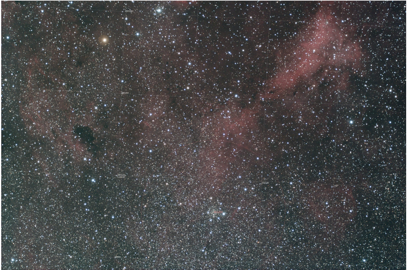
LBN 251 (telescopio/telescope #2) mappa oggetti (DSO map). Visibile l'ammasso aperto IC 1311 (open cluster IC 1311 is shown) – 05/11/2021