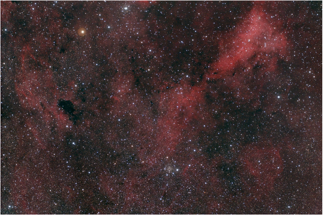
LBN 251 (telescopio/telescope #2) – 05/11/2021