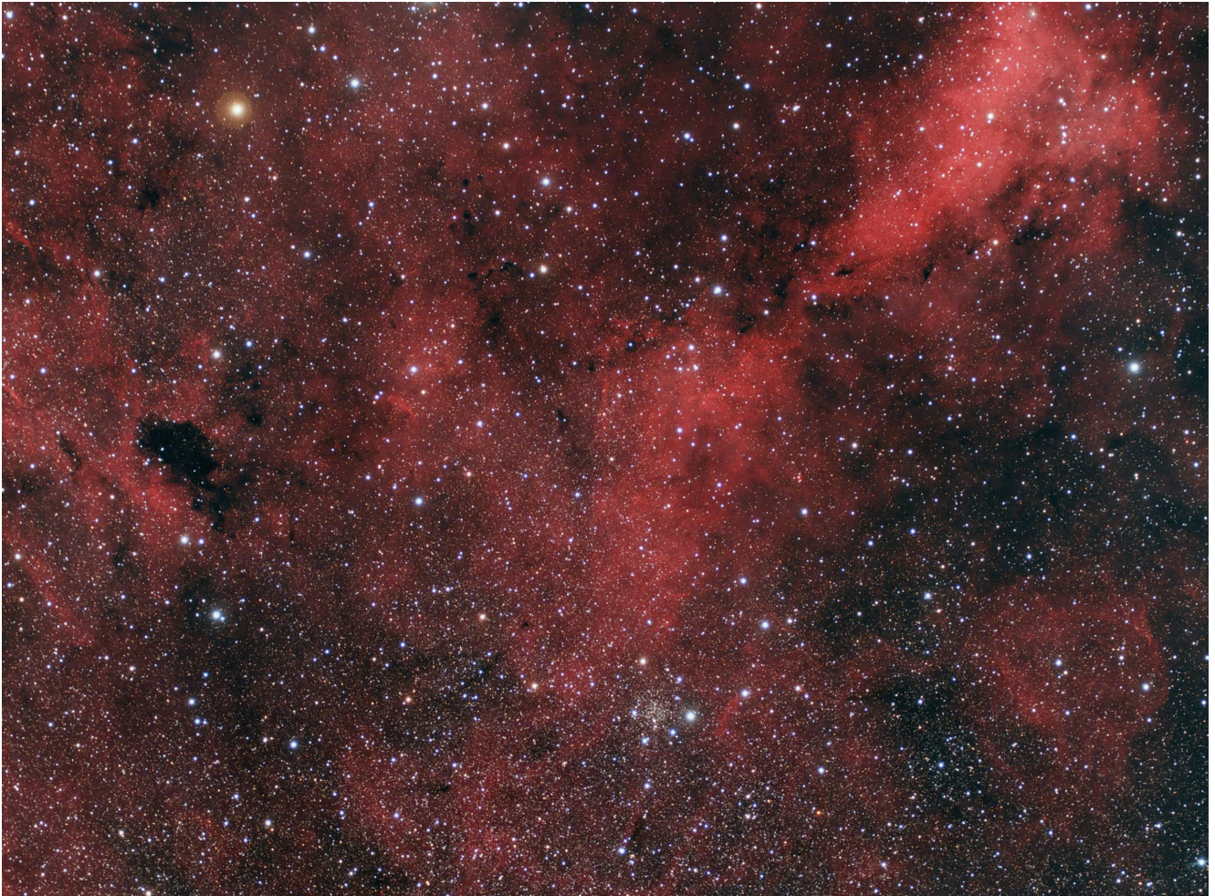
LBN 251 (telescopio/telescope #1 and #2) composizione/composition (50% H\alpha +50%R)GB - 05/11/2021