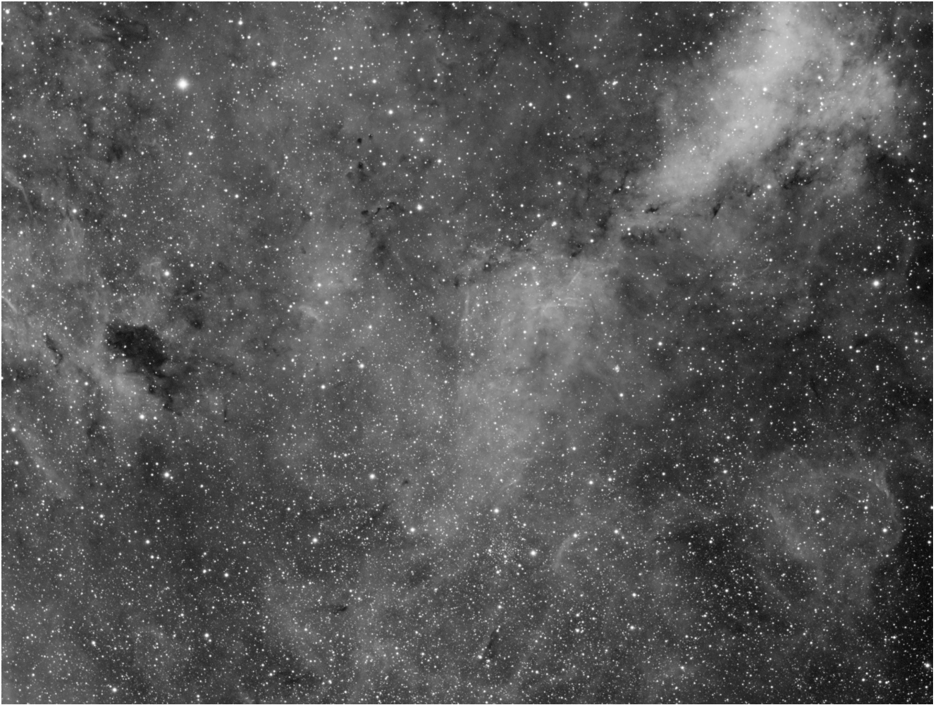
LBN 251 (telescopio/telescope #1) – 05/11/2021