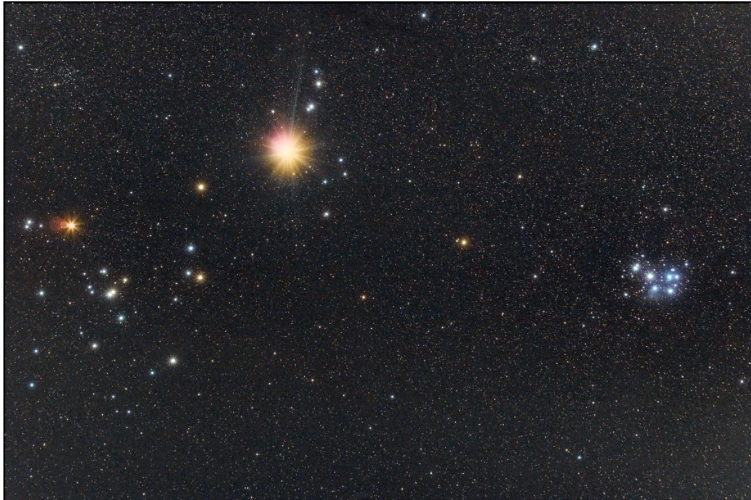
Pleiadi, Iadi e Giove - 02/03/2013

postiamo anche la versione dove sono indicati i nomi degli ammassi aperti e le linee della costellazione / we also post a version of the picture with the names of the open cluster and constellation lines.