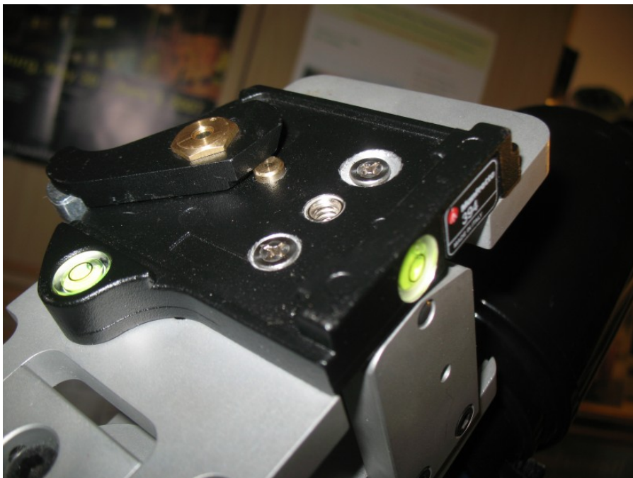
Il collegamento tra l'aggancio rapido Manfrotto 394 e la testa Geoptik GK2

A questo punto, svitate il collegamento della Geoptik GK2 a coda di rondine tipo Vixen ed avvitate l'aggancio rapido Manfrotto (basetta) al piano della testa come mostrato in figura.