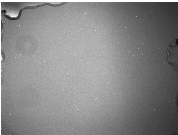
Figura 5: Flat field frame

Un problema, presente in molte camere CCD con otturatore meccanico è il noto effetto ombra ovvero l'ombra dell'otturatore durante i veloci scatti del flat frame. Tale effetto può rovinare bellissime immagini astronomiche dato che introduce un difetto sul flat che si trasforma in un gradiente artificiale difficile da togliere dalle nostre foto. Al fine di eliminare l'effetto ombra è necessario allungare i tempi di esposizione del flat. Per una camera come la ATIK 383L+ monocromatica, è stato testato che questo tempo corrisponde a circa 15 secondi. Tale valore è in principio raggiungibile dai flat field generator presenti oggi sul mercato ma solo se si scatta con filtri colorati o banda stretta e in binning 1 x 1. Se vogliamo scattare in luminanza o con binning superiori allora molti dei flat field generator presenti sul mercato non riescono ad abbassare così tanto la luminosità della lampada da non mandare il sensore in saturazione, rendendo pertanto inutile il nostro flat frame di calibrazione. ARTESKY Flat Field invece ha una regolazione così fine della luminosità del pannello luminoso che, se posta al minimo permette di effettuare scatti in luminanza fino a bin 7x7 (vedi Figura 5). Al momento non conosciamo nessun flat field generator in grado di raggiungere tale valore senza modifiche esterne.