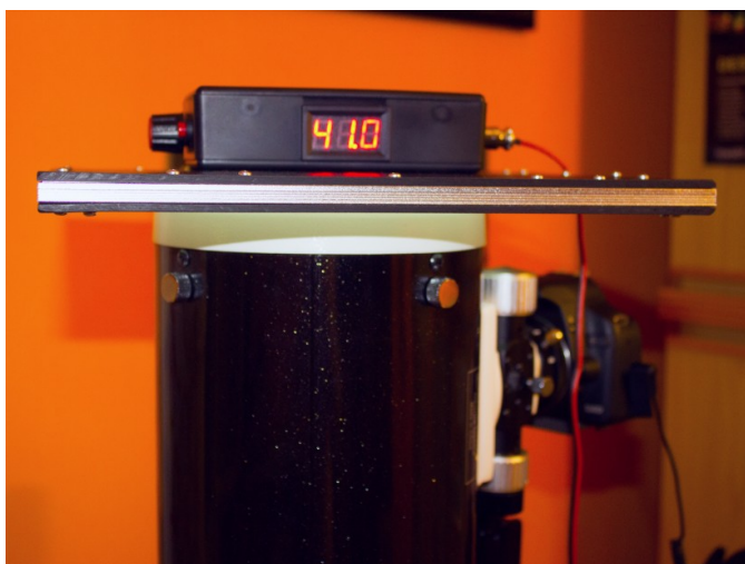
Figura 2: l'ARTESKY Flat Field applicato ad un telescopio Newton da 15 cm di diametro.

Il pezzo forte dell'ARTESKY Flat Field è il controller della luminosità . Infatti alcuni flat field generator presentano la possibilità di ridurre l'intensità luminosa ma mai così quanto l'ARTESKY Flat Field. Inoltre la presenza di uno schermo di calibrazione, rigorosamente in luce rossa, rende questo prodotto unico nel suo genere. Infatti, oltre al tasto di accensione e spegnimento è possibile regolare la luminosità dello schermo agendo su una comoda manopola, mentre sullo schermo verrà visualizzato un valore numerico ad esso associato.