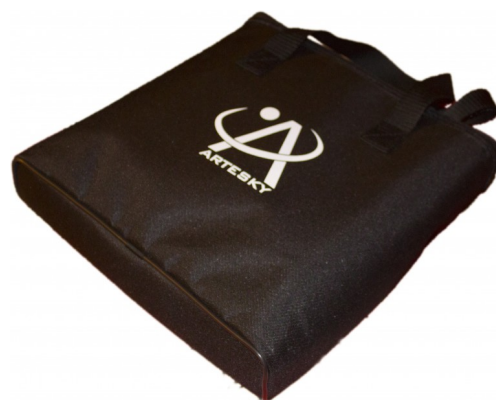
Figura 1: il contenitore dell'ARTESKY Flat Field

Iniziamo quindi con il considerare il prodotto, che a differenza di altri presenti sul mercato, viene venduto corredato di una comoda borsetta con il marchio ARTESKY inciso nel centro. Tale contenitore è risultato robusto e curato nei minimi dettagli (vedi Figura 1).