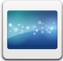
IMG_0039.CR2 21,8 MB dom 19 ago 2012 02:31:41 CEST

Alcune DSLR permettono il salvataggio RAW + JPEG, utile per visualizzare velocemente le informazioni contenute nel file RAW