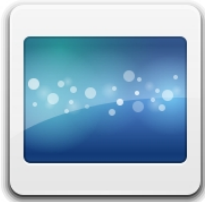
IMG_0039.CR2 21,8 MB dom 19 ago 2012 02:31:41 CEST

Alcune DSLR permettono il salvataggio RAW + JPEG, utile per visualizzare velocemente le informazioni contenute nel file RAW