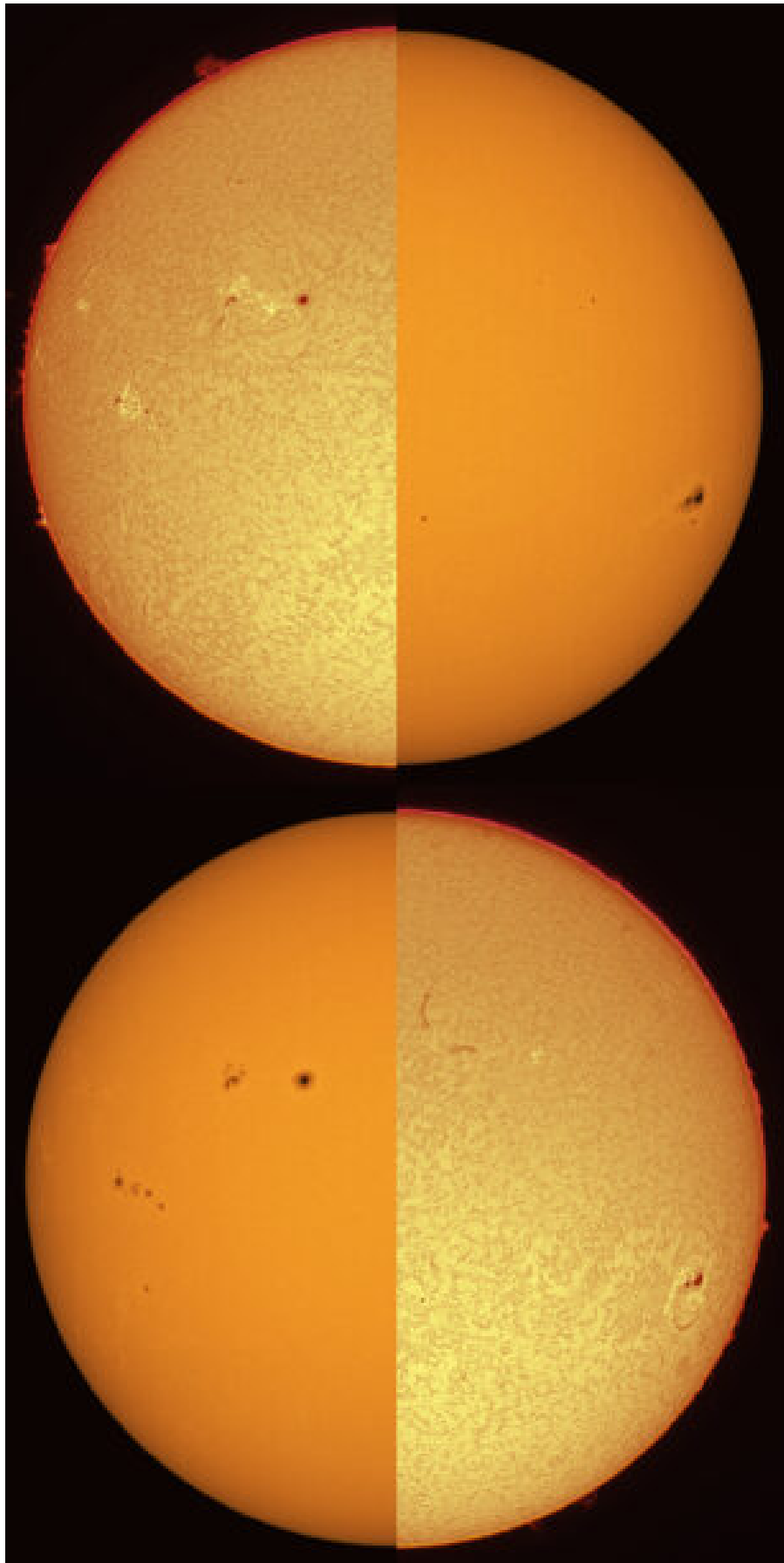
Sole in H \alpha e nel continuo – 16/07/2023