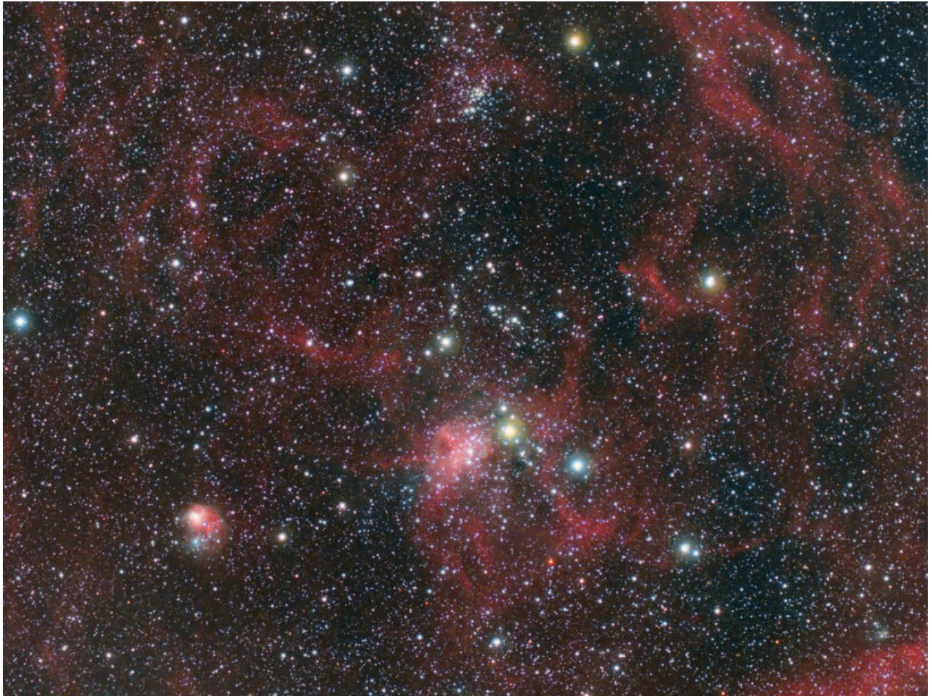
IC 417 (telescopio/telescope #1 and #2) composizione/composition (50%H \alpha +50%R)GB - 16/03/2021