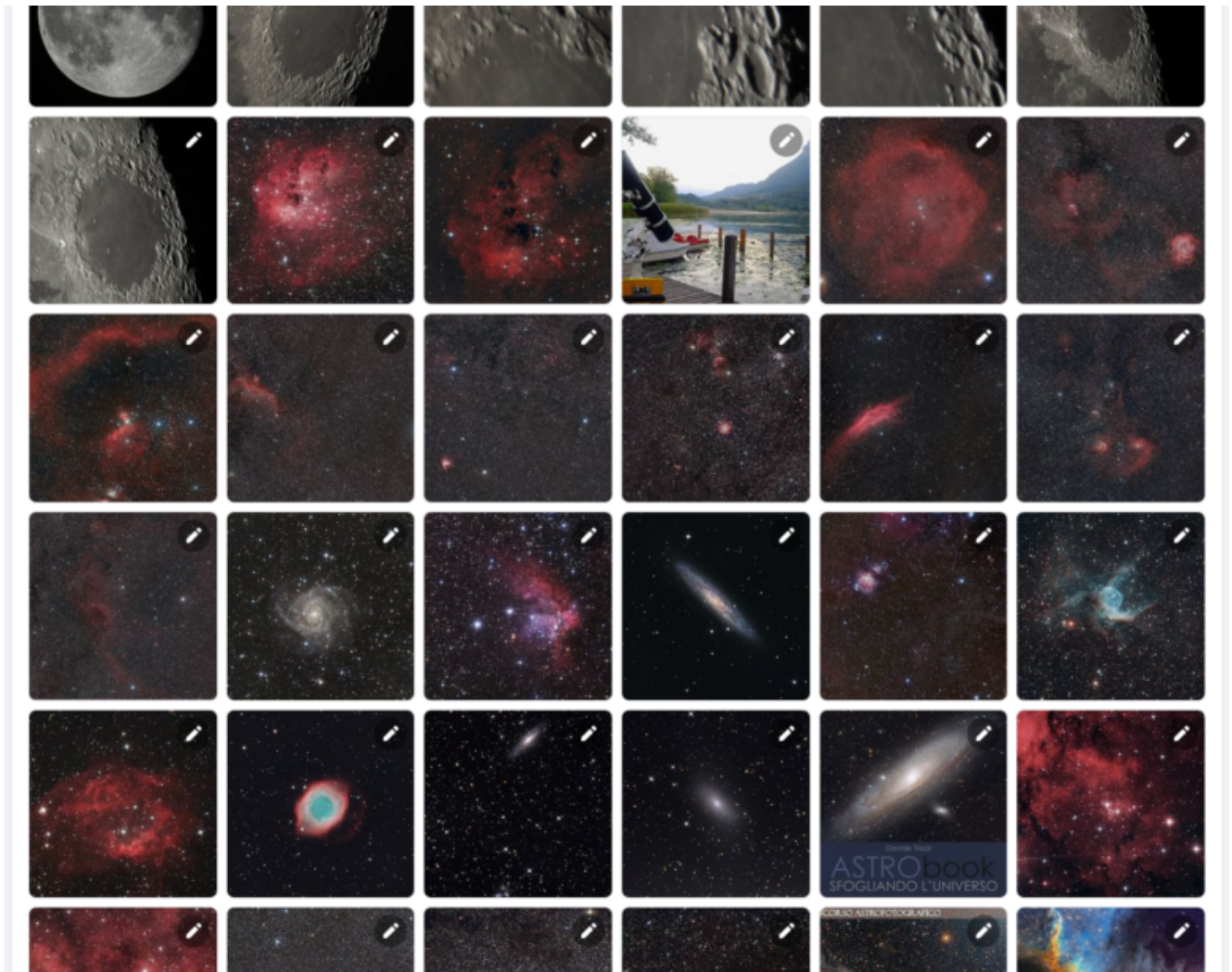
La galleria fotografica della pagina.