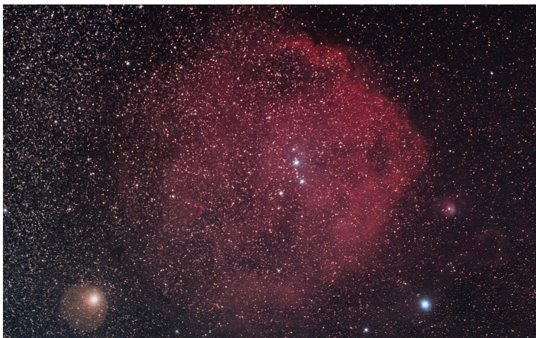
Sh2 264 - 06/01/2016

colori della nebulose (false color picture is also reported)