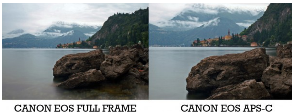
Figura 1: A sinistra il paese di Varenna (LC) ripreso con una full frame (equivalente). A destra lo stesso paesaggio con una APS-C

Partiamo iniziando con il dire che la lunghezza focale di un obiettivo (fisso o fissata ad un determinato valore nel caso degli zoom) non può cambiare e per un telescopio rifrattore coincide con la distanza tra la lente ed il piano focale, ovvero dove viene focalizzata l'immagine. Quindi un obiettivo 300 mm sarà e rimarrà sempre un 300 mm.