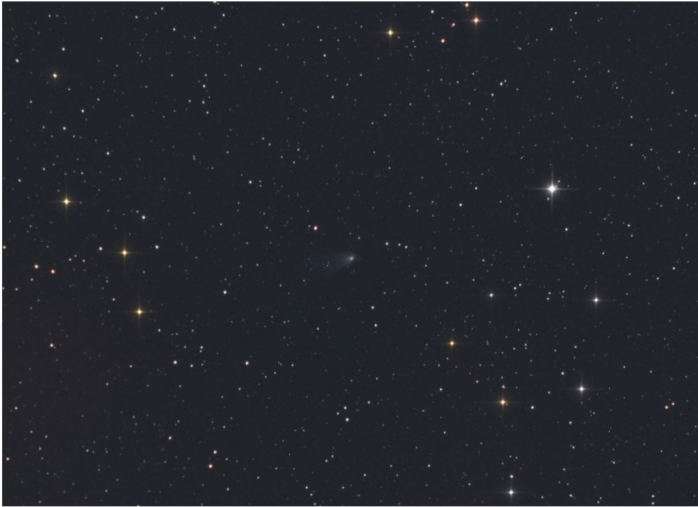
Cometa C/2015 F4 (Jacques) - 25/08/2015