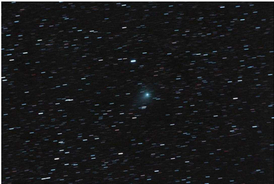
C/2009 P1 (Garradd) - 31/08/2011

Calibrazione effettuata con 20 flat, 6 dark, 15 bias. Elaborazione IRIS + Photoshop CS2.