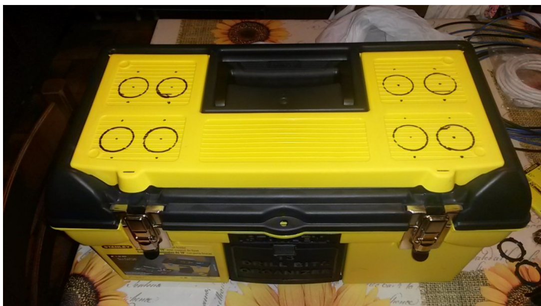
Figura 1: la posizione delle porte accendisigaro sulla cassetta degli attrezzi

Iniziamo pertanto con il forare la nostra cassetta degli attrezzi in modo da poter fissare le porte accendisigaro come riportato in figura 1.