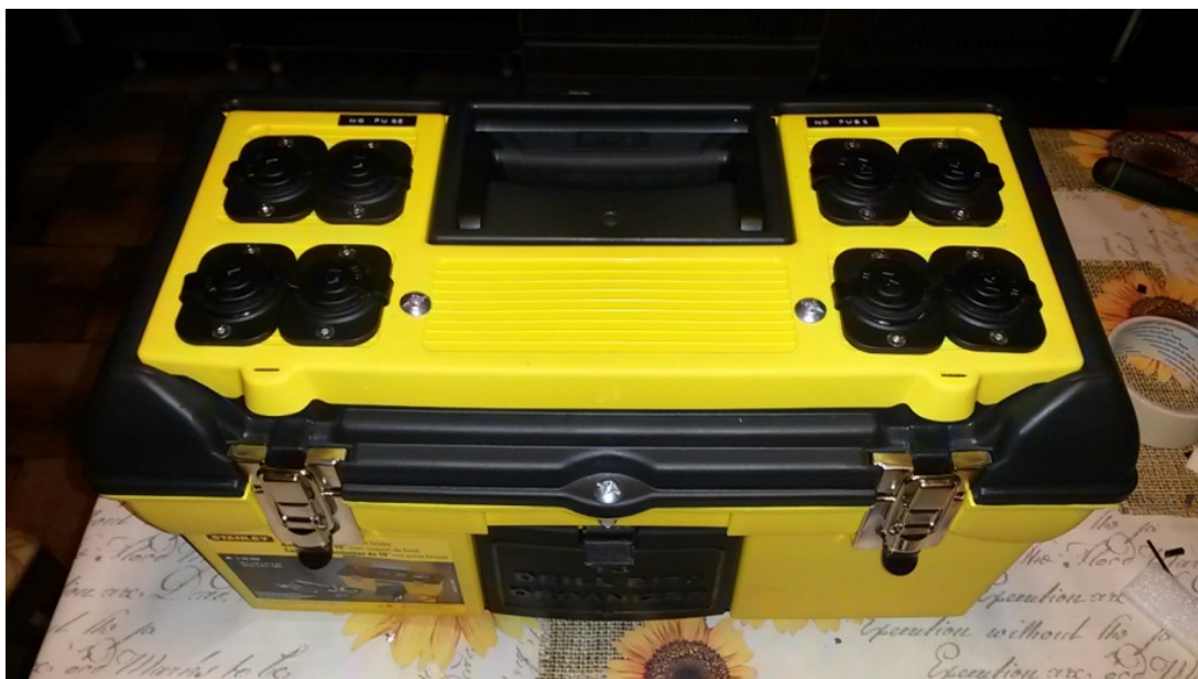
Figura 5: il power box completo.

Non ci resta quindi che chiudere la cassetta degli attrezzi assicurandone bene il serraggio (eventualmente fissando il tutto con viti passanti) e mettere il tutto sotto carica (Figura 5). Grazie a questo sistema ora avrete un'autonomia di parecchie ore da sfruttare nelle lunghe e fredde notti invernali: buon divertimento!