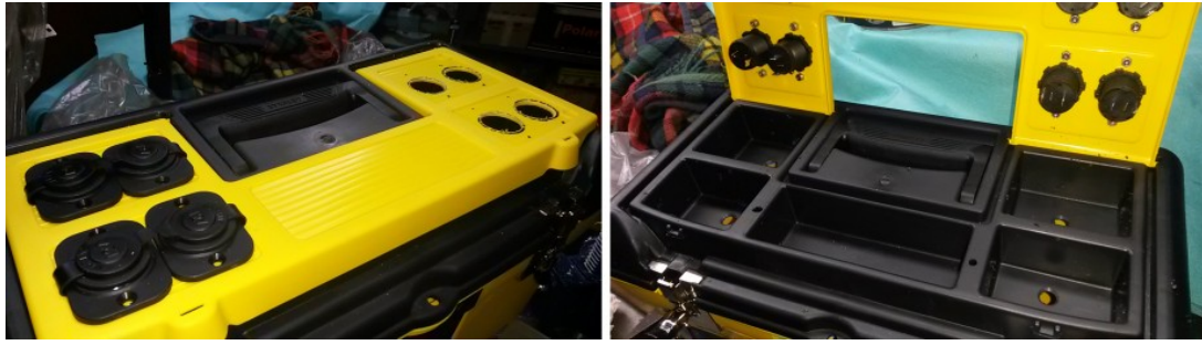
Figura 2: a sinistra l'installazione delle porte accendisigaro, a destra i fori passanti che permettono di collegare le porte alla batteria

Ora si può cominciare a saldare i cavi. Consiglio vivamente, per questione di ordine e sicurezza, di utilizzare due colori diversi per il polo positivo e negativo. Saldate i cavi relativi al polo positivo della batteria sul connettore della porta accendisigari con indicato il simbolo (+) e quelli relativi al polo negativo sull'altro connettore. In una posizione comoda del cavo relativo al polo positivo saldate il porta-fusibile. In ogni caso, consiglio invece della saldatura, l'utilizzo di comodi mammut. Inserire quindi il fusibile nel relativo porta-fusibile dopo averne verificato il funzionamento. Lasciate una porta accendisigari priva di fusibile. Questa vi servirà per caricare la batteria con caricabatterie esterne (utilizzate pure porte alternative all'accendisigari in funzione del cavo di ingresso dal caricabatterie). Il valore di corrente del fusibile deve essere scelto in funzione del carico che volete applicare. Nel nostro caso sono stati utilizzati fusibili da 10A. Un'immagine del sistema di connessioni è riportato in figura 3.