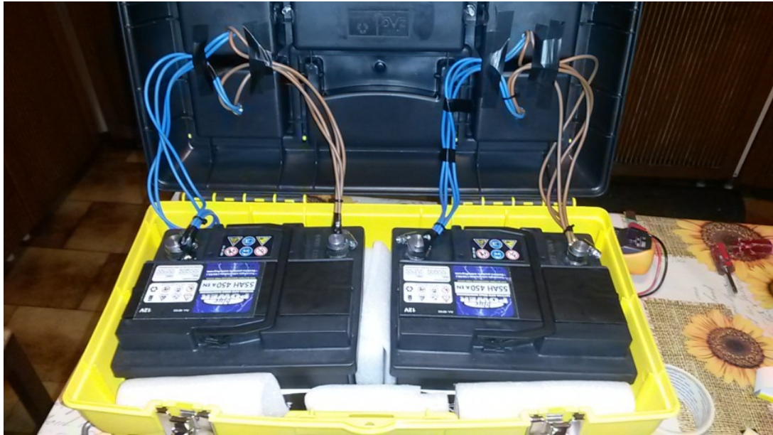
Figura 4: connessioni con la/le batteria/e. Ricordatevi di fissare le batterie nella cassetta degli attrezzi.

Non ci resta quindi che chiudere la cassetta degli attrezzi assicurandone bene il serraggio (eventualmente fissando il tutto con viti passanti) e mettere il tutto sotto carica (Figura 5). Grazie a questo sistema ora avrete un'autonomia di parecchie ore da sfruttare nelle lunghe e fredde notti invernali: buon divertimento!