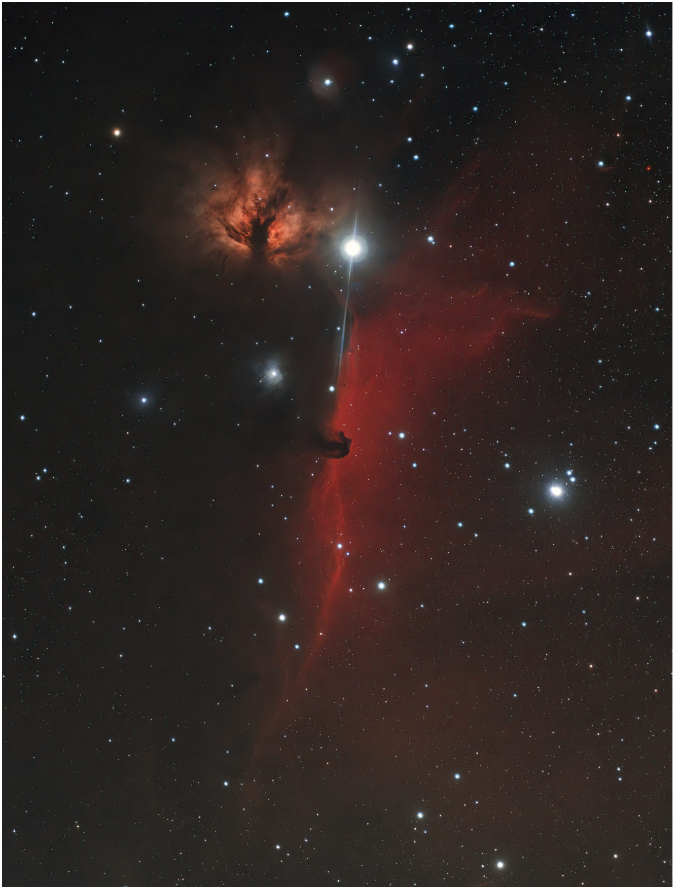
B33 (telescopio/telescope #1 and #2) composizione/composition (50%H \alpha +50%R)GB – 01/03/2022