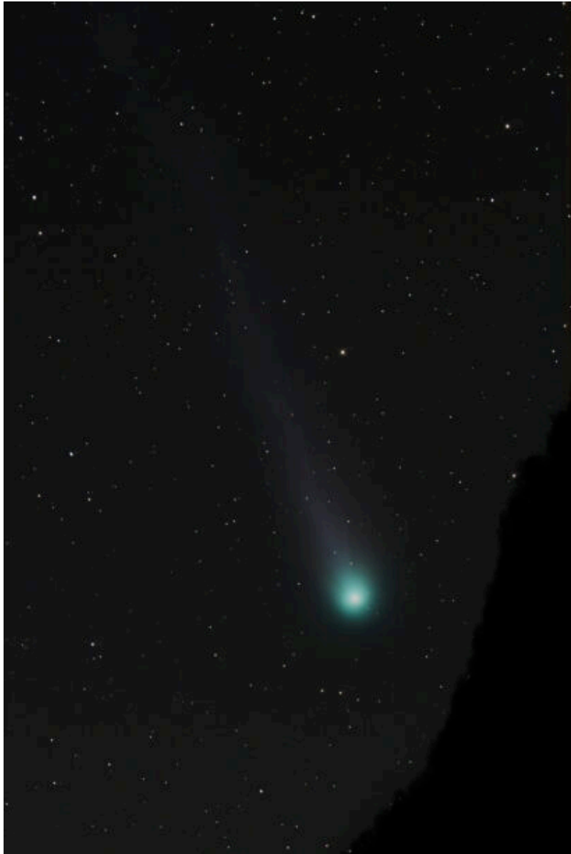
12P/Pons-Brooks con paesaggio (with landscape) – 16/03/2024

riportiamo anche una versione a luminosità più alta per la visione da smartphone (a smartphone version is also reported):