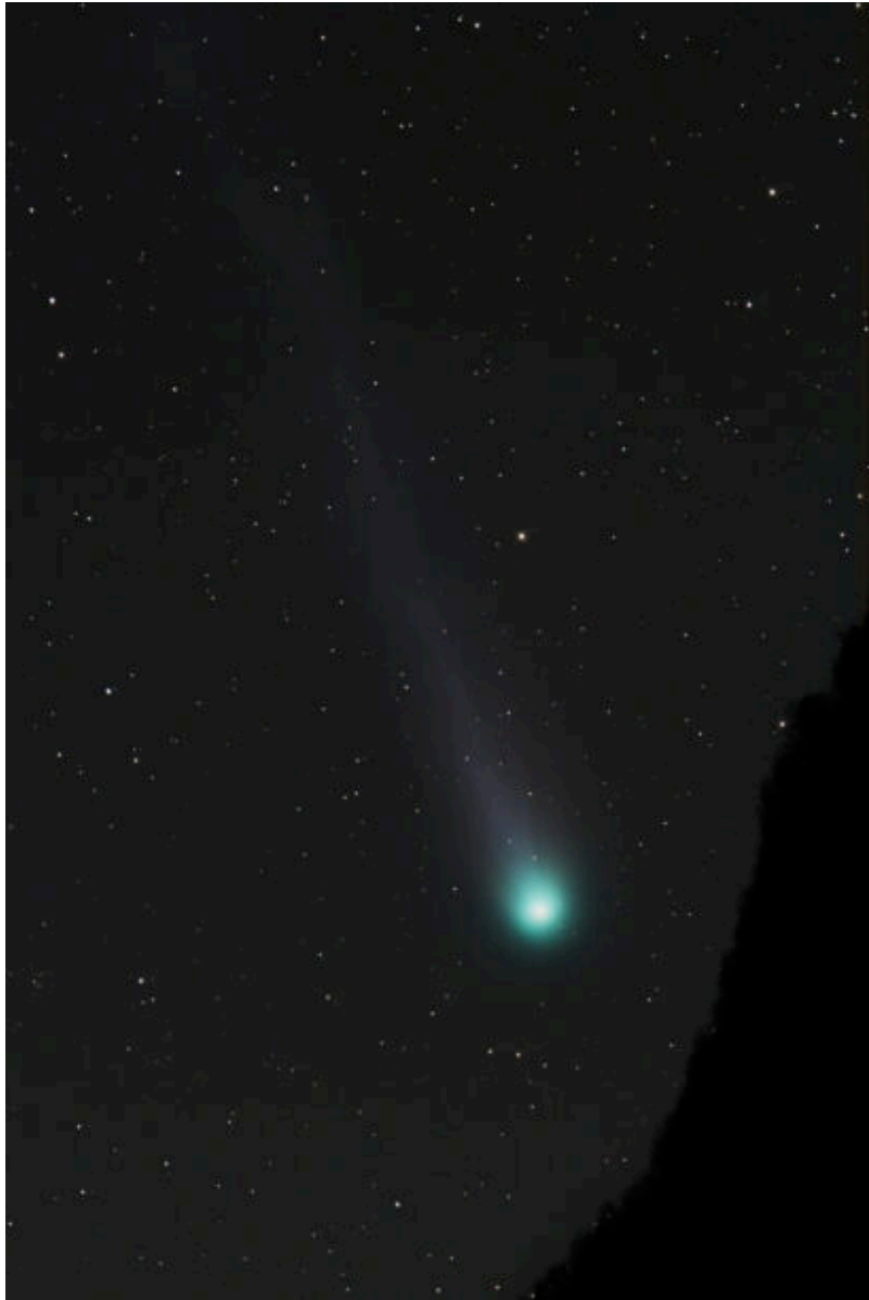
12P/Pons-Brooks con paesaggio (with landscape) – 16/03/2024