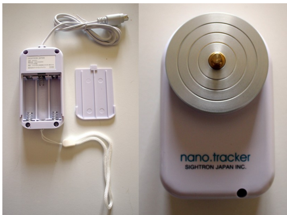
Figura 2: il telecomando di controllo a sinistra e l'astroinseguitore a destra.

Entrambe i pezzi risultano di ottima fattura e curati nei minimi dettagli. Abbiamo particolarmente apprezzato è il comodo laccio per legare il telecomando al treppiede durante le riprese. Si procede quindi con l'inserimento delle batterie nel telecomando di controllo tramite l'apposito cassetto (vedi Figura 2).