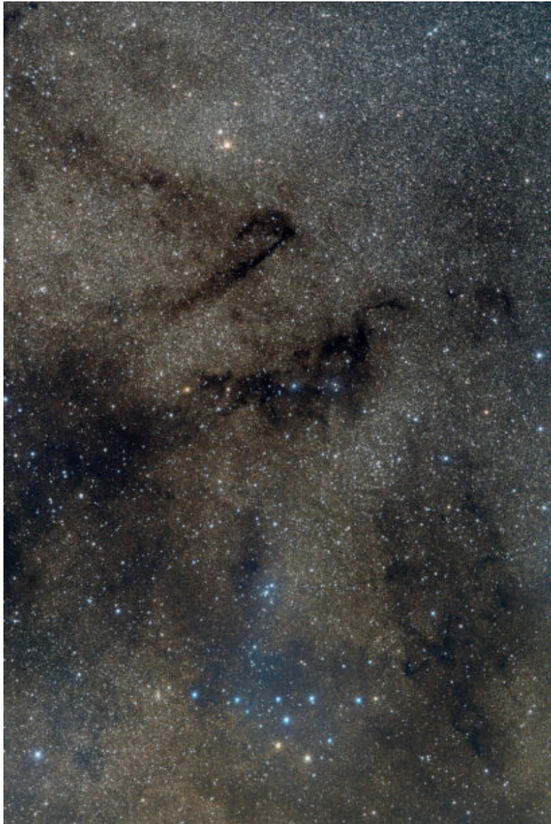
Cr 399 – 15/08/2023