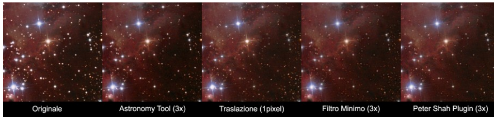
Fig. 3: Confronto tra l'applicazione dei quattro metodi illustrati in questo articolo per la riduzione dei diametri stellari.

quattro metodi di riduzione dei diametri stellari appena illustrati al fine di valutarne l'efficacia e la qualità. In Figura 3 è illustrato il risultato di questo test.