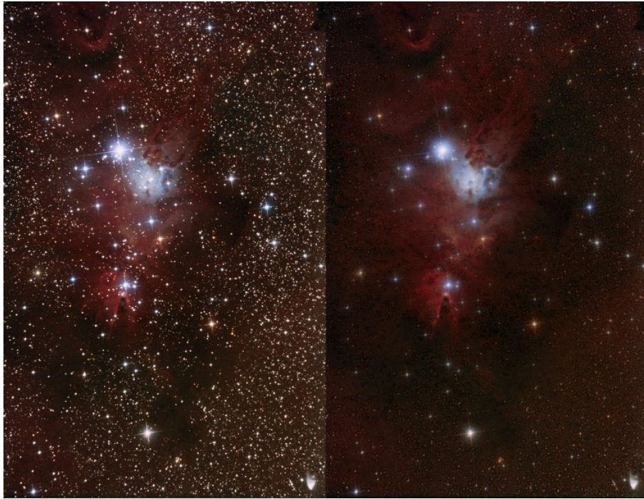
Fig. 1: Immagine della nebulosa Cono con e senza la riduzione dei diametri stellari.

In particolare abbiamo analizzato quattro tra le più note tecniche di riduzione dei diametri stellari con Photoshop nel mondo dell'astrofotografia digitale: Astronomy Tool, Traslazione, Filtro Minimo, Peter Shah.