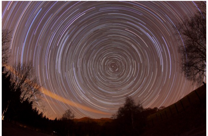
Il polo celeste nord ripreso da Sormano - CO.

Alla fine della nottata otterrete tanti trattini sconnessi. Dateli in pasto al programma StraTrails e come per magia si trasformeranno in rotazioni celesti! Se poi puntate la stella polare vedrete come le strisciate (trail) diventeranno dei perfetti cerchi.