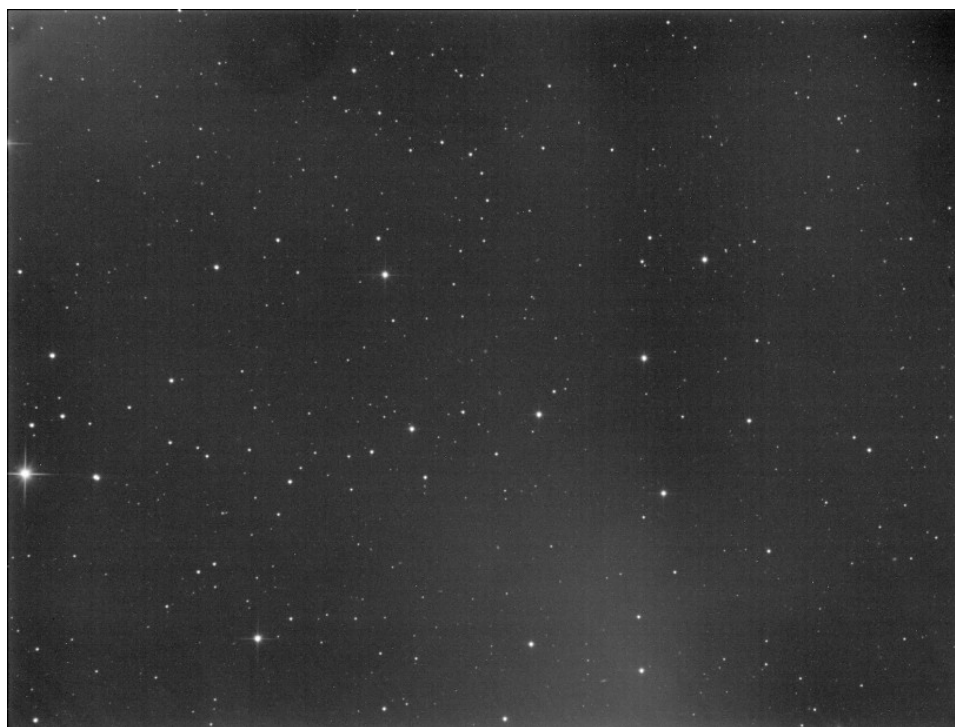
(136108) Haumea, scatto originale - 18/03/2016

Note (note): riduzione effettuata con xparallax