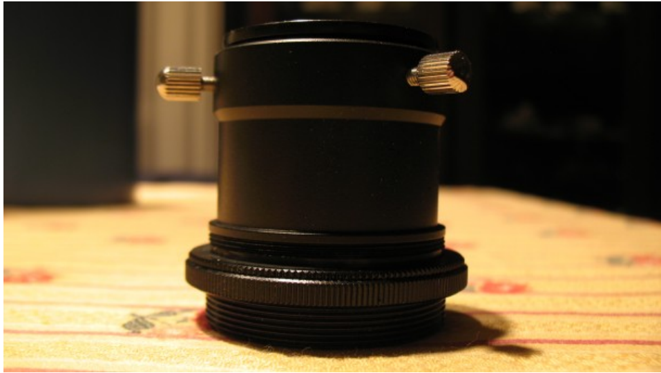
Figura 4 : il barilotto porta oculari

Data la scarsa qualità della cremagliera è consigliabile fuocheggiare lasciando allentata la vite di fissaggio e bloccare il tutto solo quando lo strumento si trova nella posizione definitiva. Quando collimate il telescopio ricordatevi quindi di serrare la vite di fissaggio del fuocheggiatore riproducendo così la condizione di ripresa fotografica.