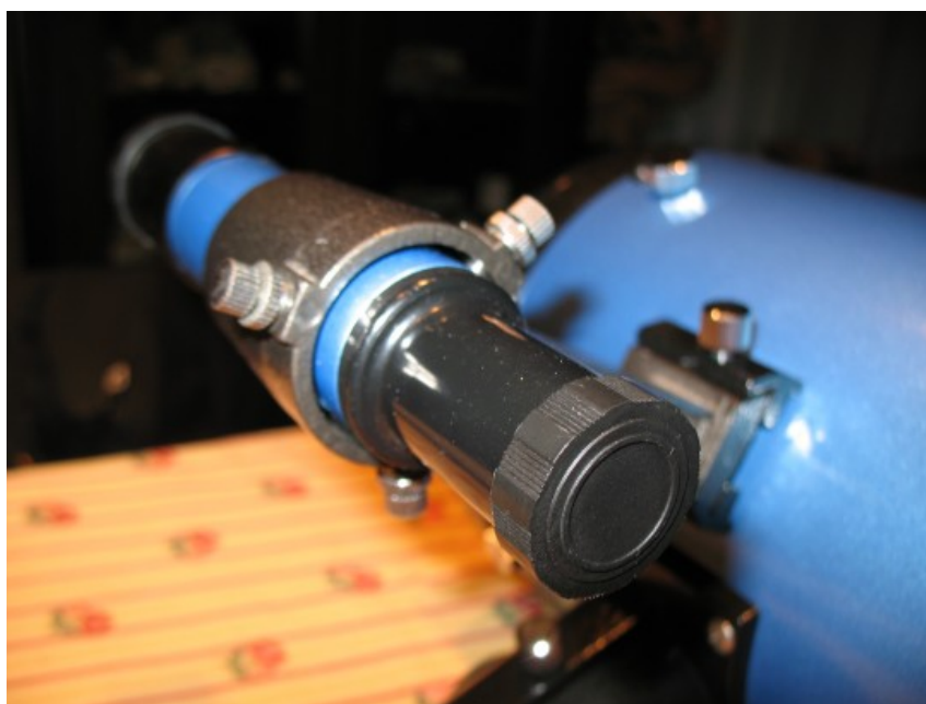
Figura 6 : Immagine del cercatore 6 x 30 SkyWatcher.

Il cercatore è un 6 x 30 originale dello stesso colore del telescopio. Il sostegno invece è stato sostituito con quello di un rifrattore acromatico Antares Venere del 1998. Questo presenta tre viti di regolazione ed al suo interno il cercatore è fissato con un elastico invece della guarnizione originale (OR) andata distrutta a seguito di un forte sbalzo termico. L'immagine del cercatore è riportata in figura 6.