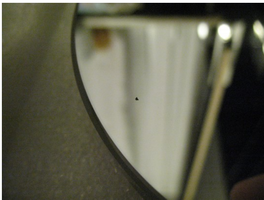
Figura 1 : Il piccolo granello di vernice nera depositata sullo specchio

Lo specchio primario si presenta circolare, del diametro pari a 15 cm con disegnato nel centro un anello utile ai fini della collimazione. Questo è stato sottoposto dal 2008 al 2012 ad ogni tipo di condizione atmosferica. La pulizia dello specchio è stata effettuata il giorno 25 Settembre 2012. Questa ha rimosso ogni tipo di sporco tranne un granello nero di vernice (quella che riveste il supporto dello specchio secondario, vedi figura 1), che si è ancorato alla superficie dello specchio. Per rimuoverlo sarebbe stato necessario applicare un mezzo abrasivo (o contundente) che avrebbe rovinato la superficie dello specchio. Pertanto, date le piccolissime dimensioni del grano si è deciso di non procedere accettando una perdita di luce stimata inferiore allo 0.001%.