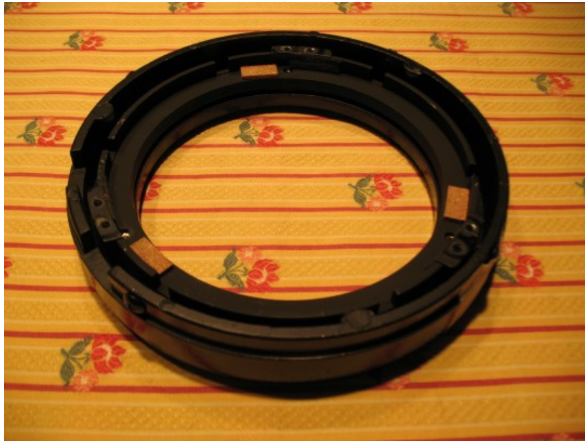
Figura 2 : cella di sostegno dello specchio primario. Ben visibili sono i tre spessori di sughero.

La cella dello specchio primario è ben fatta con tre viti di regolazione dotate di buona mobilità (si consiglia di allentarle leggermente prima di procedere con la collimazione dello strumento). Lo specchio è appoggiato su tre spessori di sughero come mostrato in Figura 2.