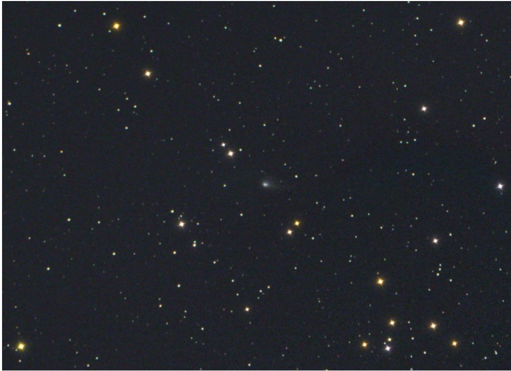
Cometa 67P/Churyumov-Gerasimenko - 26/08/2015