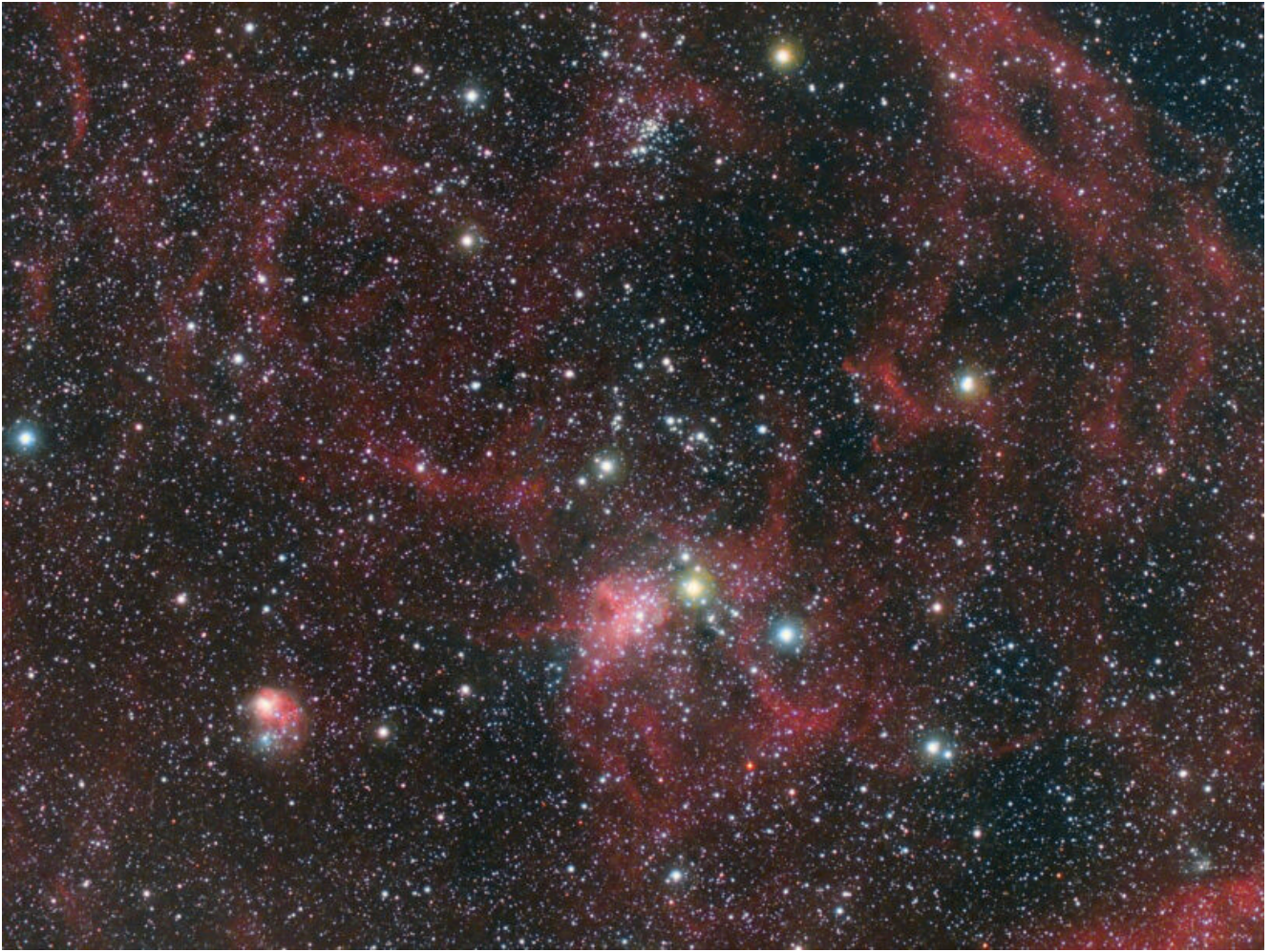
IC 417 (telescopio/telescope #1 and #2) composizione/composition (50% H\alpha +50%R)GB – 16/03/2021