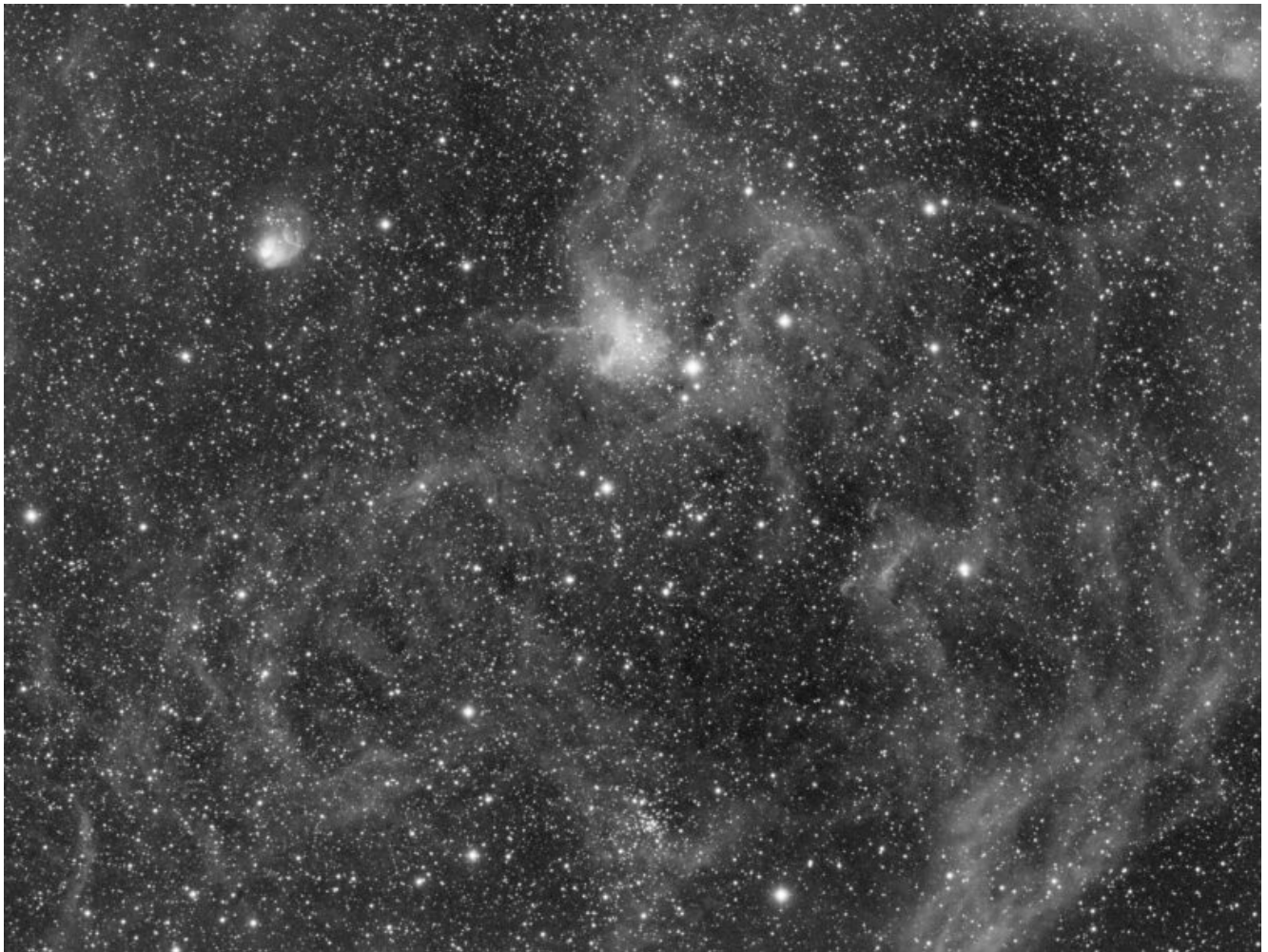
IC 417 (telescopio/telescope #1) – 16/03/2021