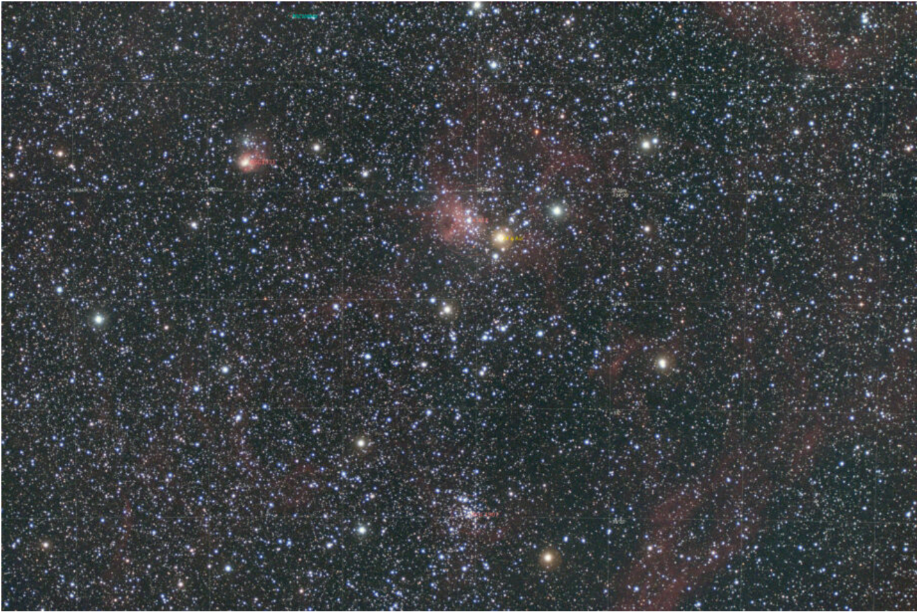
IC 417 (telescopio/telescope #2) mappa oggetti (DSO map). Visibili l'ammasso aperto NGC 1907 e la nebulosa NGC 1931 (the open cluster NGC 1907 and the nebula NGC 1931 are shown) – 16/03/2021