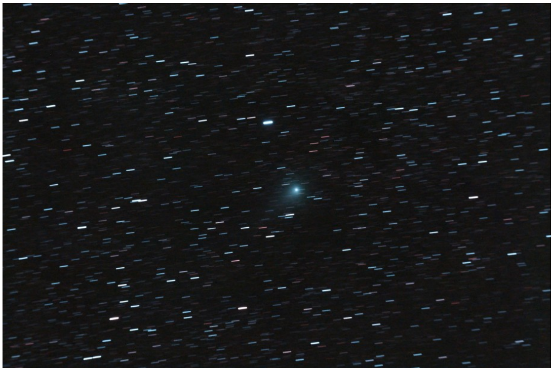
C/2009 P1 (Garradd) - 31/08/2011

Calibrazione effettuata con 20 flat, 6 dark, 15 bias. Elaborazione IRIS + Photoshop CS2.