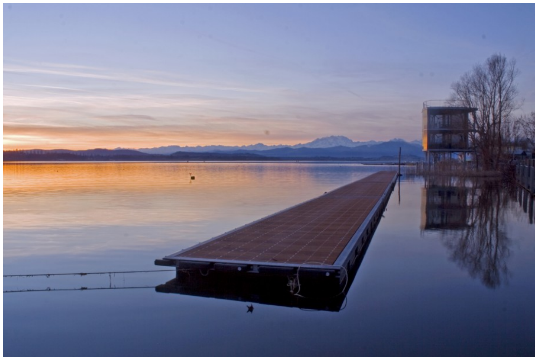
Figura 3: tramonto in modalità scatto normale HDR.

scatto comparirà perfettamente uniforme e di colore nero.