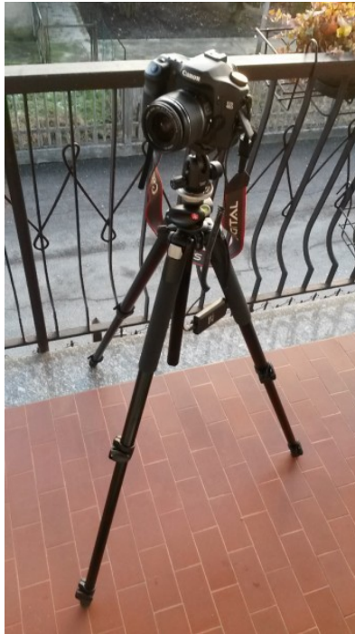
Figura 1: setup astrofotografico: corpo macchina, obiettivo, telecomando per scatto remoto, cavalletto fotografico.