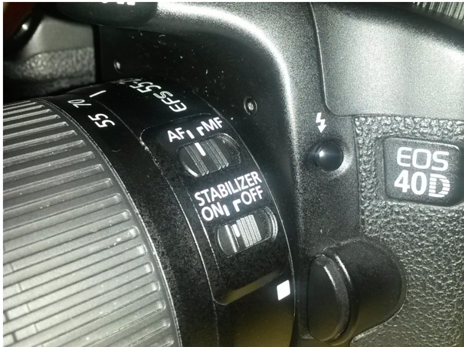
Figura 3: Leva per azionare lo scatto in auto-focus (AF) e lo stabilizzatore (ON).

sensibilità pari a 400 ISO. Giunti a questo punto verificate che lo stabilizzatore e l'auto-focus relativo al vostro obiettivo siano azionati (stabilizzatore su ON, messa a fuoco su AF), come riportato in Figura 3.