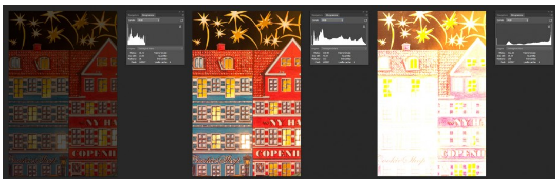
Figura 4: Da sinistra a destra una foto sottoesposta, correttamente esposta e sovraesposta con i relativi istogrammi.

delle immagini quali GIMP o Photoshop CS ed apriamo l'utility Istogramma, disponibile ad esempio in Photoshop cliccando sul menù Finestra → Istogramma. Avremo modo di imparare più a fondo il significato di questo grafico nelle prossime lezioni. Per il momento utilizziamolo semplicemente per scoprire se la nostra immagine è ben esposta. Per fare ciò osserviamone la forma. Se l'istogramma è spostato verso destra allora la nostra immagine è sovraesposta, altrimenti sarà sottoesposta. Un'immagine correttamente esposta sarà quella il cui istogramma è ben distribuito lungo tutto il range di variabilità (vedi Figura 4).