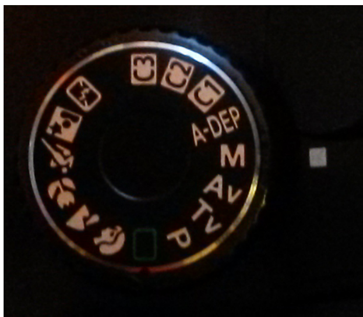
Figura 2: ghiera dei menù di una Canon EOS 40D. Come si vede è stato selezionato il menù manuale M.

Individuati i due fattori principali da cui dipende il tempo di esposizione, ovvero valore del diaframma e sensibilità, siamo pronti per iniziare. Iniziamo quindi con il settare il valore del diaframma. Supponiamo a titolo di esempio di voler scattare a f/10. Andiamo quindi a selezionare dalla ghiera dei menù della nostra fotocamera digitale la lettera M (manuale) o nel caso ci fosse B (bulb). A titolo di esempio riportiamo la ghiera dei menù della Canon EOS 40D (Figura 2).