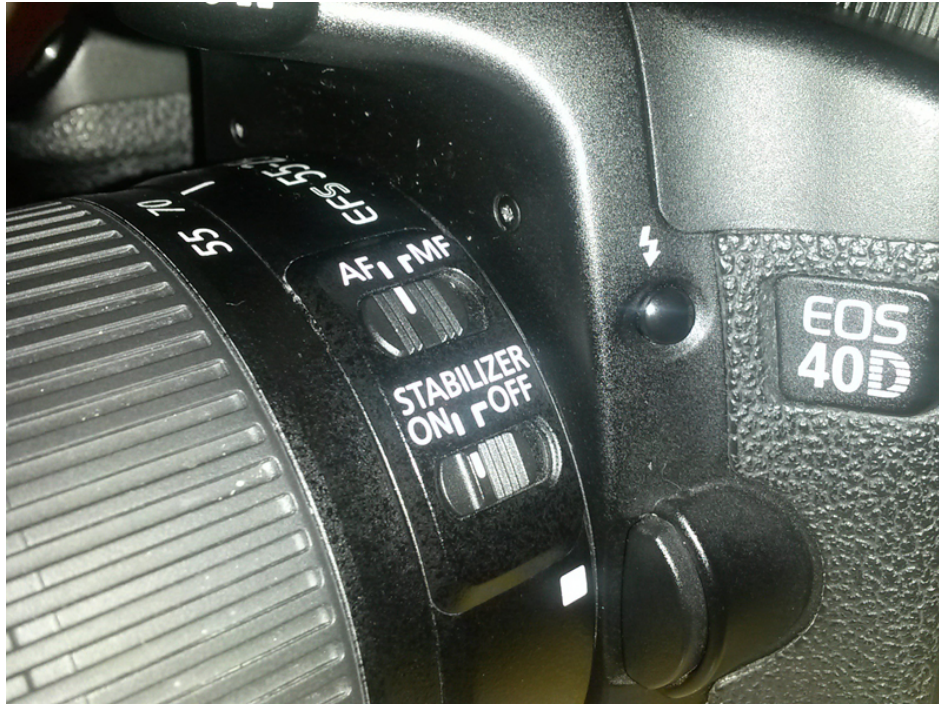
Figura 3: Leva per azionare lo scatto in auto-focus (AF) e lo stabilizzatore (ON).

sensibilità pari a 400 ISO. Giunti a questo punto verificate che lo stabilizzatore e l'auto-focus relativo al vostro obiettivo siano azionati (stabilizzatore su ON, messa a fuoco su AF), come riportato in Figura 3.