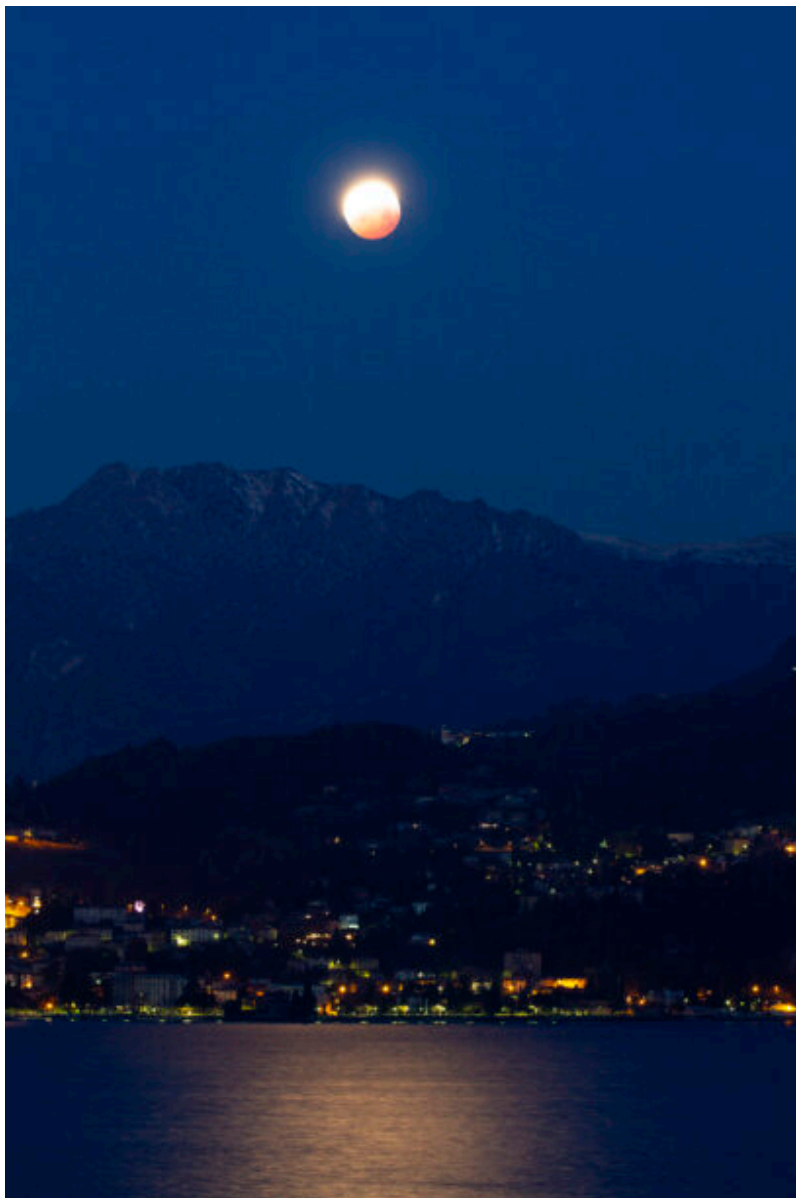
Eclissi totale di Luna su Menaggio (CO).

DETTAGLI: l'immagine è stata ripresa con una Canon EOS 500D modificata per l'astrofotografia e telescopio Newton 200 mm f/5. Essa è uno scatto singolo da 5 secondi di posa a 200 ISO. Riprese effettuate il 27/07/2018 da Montefiore dell'Aso (AP) . Dati tecnici disponibili all'indirizzo https://www.astrotrezzi.it/2018/08/eclissi-totale-di-luna-27072018/ .