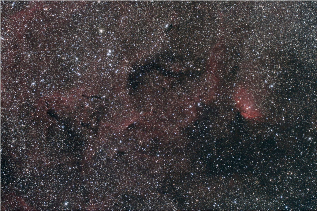
LBN 174 (telescopio/telescope #2) – 02/10/2022