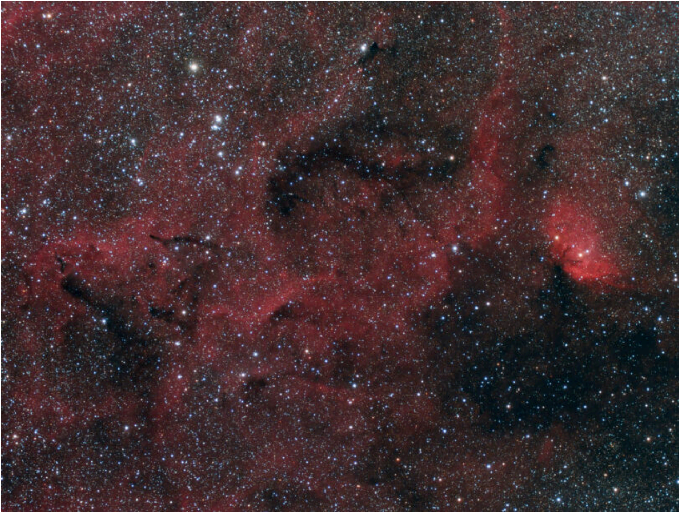
LBN 174 (telescopio/telescope #1 and #2) composizione/composition (80%H \alpha +20%R)GB - 02/10/2022