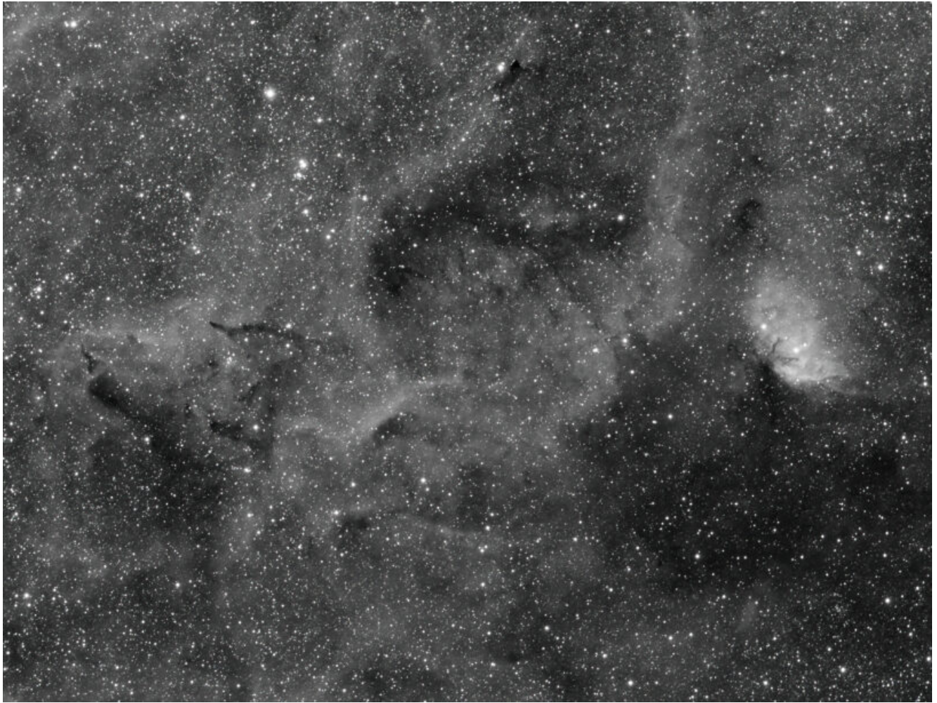
LBN 174 (telescopio/telescope #1) – 02/10/2022